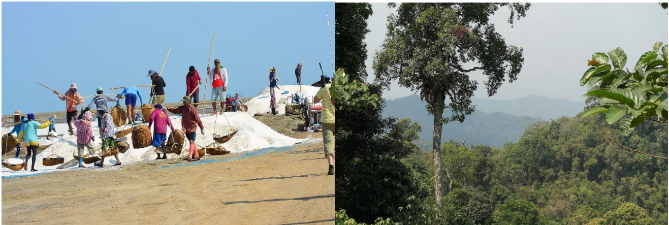
Fra saltsalinene ved Pak Thale og nesten urørt regnskog i Kaeng Krachan

Vi besøkte et bredt spekter av naturtyper. Sør for Bangkok besøkte vi noen utrolig saltsaliner og kystområder langs Siambuktas vestside. I skogen ved Kaeng Krachan hadde vi mange uforglemmelig opplevelser. I nord opplevde vi yrende fugleliv i rismarkene ved Thaton og Chiang Saen, tusener av ender på Chiang Saen Lake og fantastiske regnskogsområder rundt fjellen Doi Inthanon, Doi Ang Khang og Doi Lang. Doi Inthanon er det høyeste fjell i Thailand, hele 2565 meter over havet. Det går bilvei helt til toppen og stedet er et meget populært turistmål.