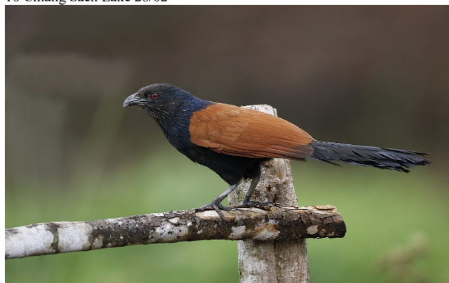
Orientsporegjøk, Chiang Saen

1 Wat Khao Takaro 16/02 2 hørt Baan Maka 16/02 1 hørt Baan Maka 17/02 1 Baan Maka 18/02 1 Baan Maka og veien 19/02 3 Huang Hong Krai 21/02 1 Doi Ang Khang 22/02 1 Thaton rismarker 23/02 1 Chiang Saen Lake 25/02 2 Nam Kham 26/02 10 Rismarker øst for Chiang Saen Lake 26/02 10 Chiang Saen Lake 26/02