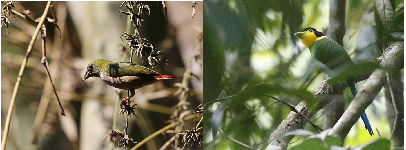
To meget vanskelige arter – nålhaleamadin og langhalebrednebb

toppen og noen av deltagerne var heldige og fikk se flere flaggermuspapegøyer som føyk som prosjektiler gjennom vegetasjonen rundt kafeen.