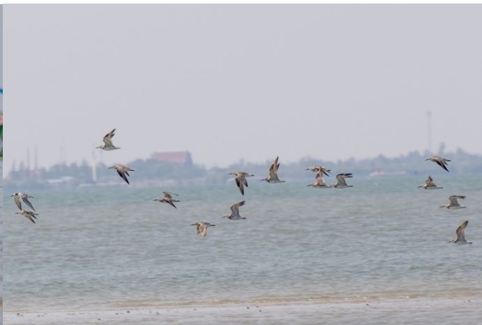
Ved utløpet av elva ved «the Split» arbeidet både mennesker og fugler for å finne godbiter i mudderet – til høyre en flokk sibirsniper på vei inn elva

Etter båtturen dro vi til kongens prosjekt i Laem Pak Bia. Her plusset vi på flere turarter og fikk nærkontakt med mange fugler og store vannvaraner. Det var dessverre litt mye annen trafikk i området da vi var der, så antall arter kunne gjerne ha vært noe høyere.