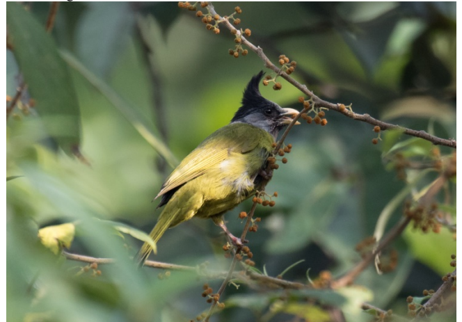
Bærspisende toppfinkebylbyl

2 Doi Ang Khang 22/02 6 Doi Lang vest 23/02 1 Doi Lang øst 24/02