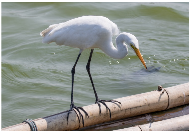
Duskhegre i kongens vannprosjekt