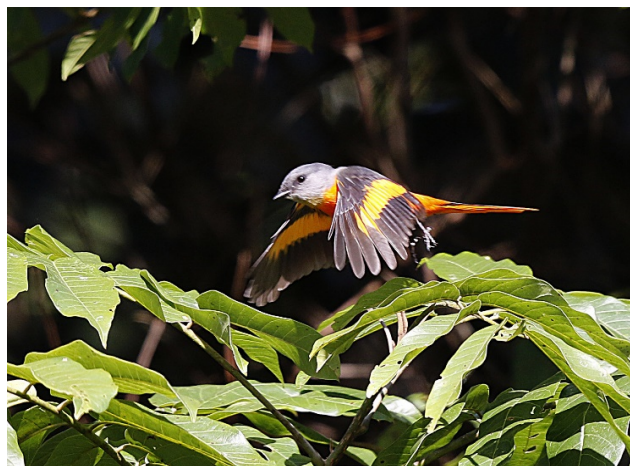
Gråhakemønjevugl, Doi Inthanon