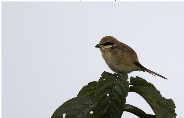
Brunvarsler, våtmarker øst for Chiang Saen Lake – Foto: Magne Myklebust