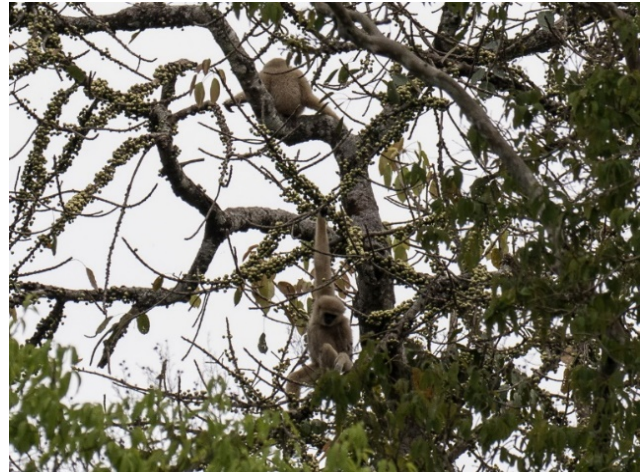
White-handed Gibbon