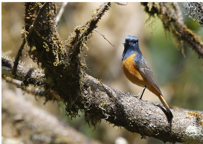
Blåhoderødstjert, Doi Inthanon

Etter lunsj dro vi mot toppen av Doi Inthanon. Vår danske venn hadde fortalt om en hann blåhoderødstjert som skulle holde seg rett ovenfor et utkikkspunkt. Vi stanset der og fant fuglen greit. Det var ikke så vanskelig å finne stedet ettersom det allerede satt en mann i kamouflasjetelt med lang linse på stedet.