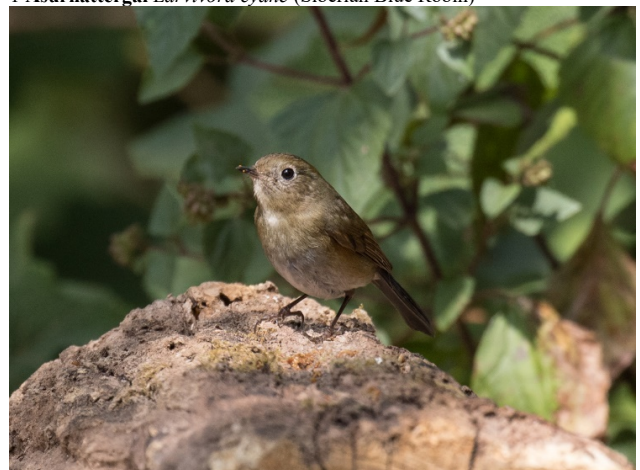
Asurnattergal hunn, Baan Songnok

3 Taigaflyesnapper Ficedula albicilla (Taiga Flycatcher)