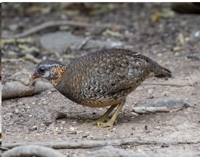
Grønnbeinhøne, Baan Songnok