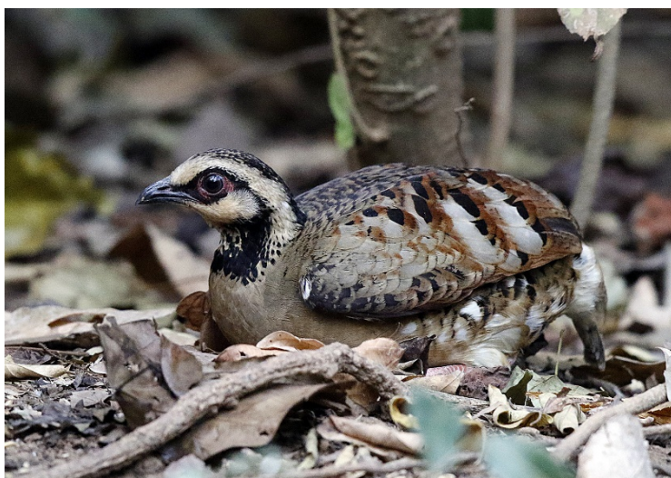
Laohøne, Baan Songnok