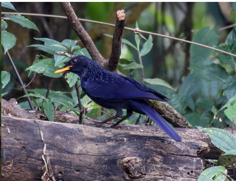
Blåplystretrøst, Doi Lang øst – Foto: Terje Axelsen

Etter en flott dag til fjells reiste vi på nytt ut på rismarkene utenfor Thaton og nye arter ble føyd til den allerede lange lista. Ute på rismarkene satt det blant annet ei gråhodevipe, ei sitronerle og godt med linerler. Overnatting i Thaton etter en ny god middag.