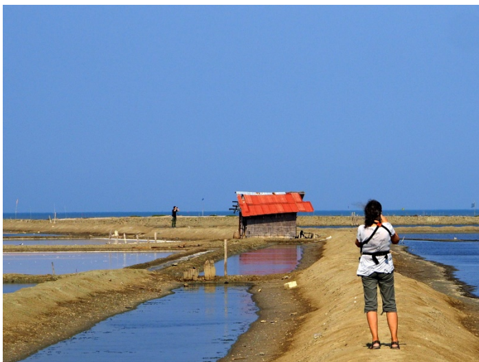
Pak Thale – stedet for skjesnipe