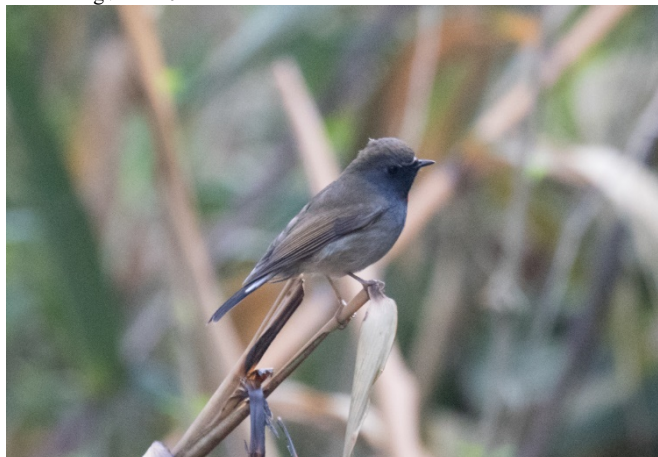
Siratfluesnapper, Doi Lang vest – Foto: Terje Axelsen

Siratfluesnapper Ficedula strophilata (Rufous-gorgeted Flycatcher) 3 Doi Lang vest 23/02 1 Doi Lang øst 24/02