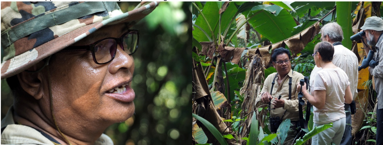
Vår reserveguide i Kaeng Krachan – på høyre bilde har han nettopp funnet langhalebrednebb

parcsenter hvor man kan få kjøpt både drikkevarer og et godt måltid mat. Mat kan man også få på toppen, men her er det litt avhengig av mengden mennesker som besøker toppen. De går ofte tom for mat tidlig på dagen. For å komme til toppen bør man ha et kjøretøy med god bakkeklaring og helst 4x4.