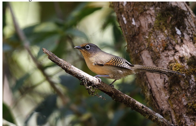
Brilleglittervinge, Doi Lang øst

Brilleglittervinge Actinodura ramsayi (Spectacled Barwing) 2 Doi Inthanon 20/02 1 hørt Doi Lang vest 23/02 4 Doi Lang øst 24/02