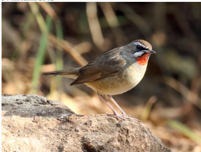
Rubinstrupe hann, Doi Lang vest