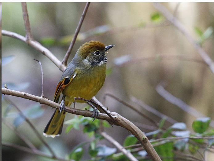
Aurorafluesnapper, Doi Inthanon