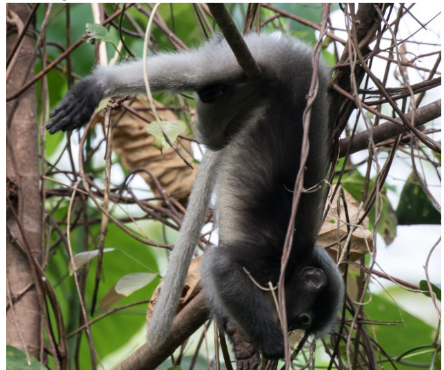
Dusky Langur