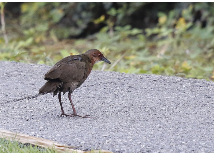
Kastanjerikse i hotellhagen