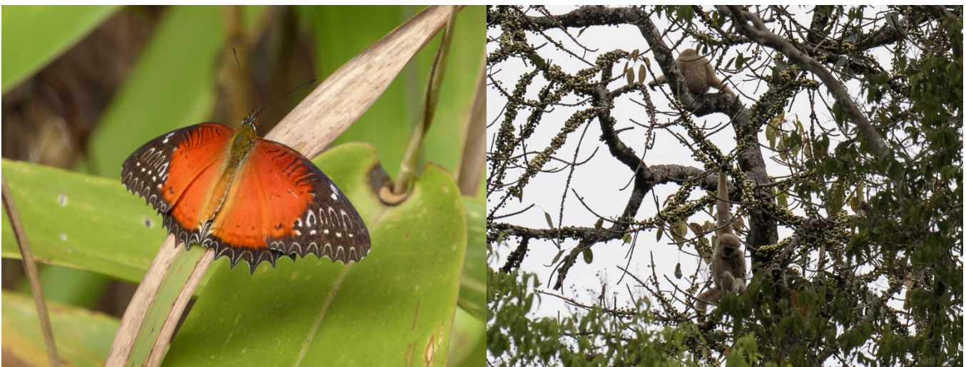
Kaeng Krachan er kjent for sommerfugler og aper. Hvithåndgibbon til høyre.