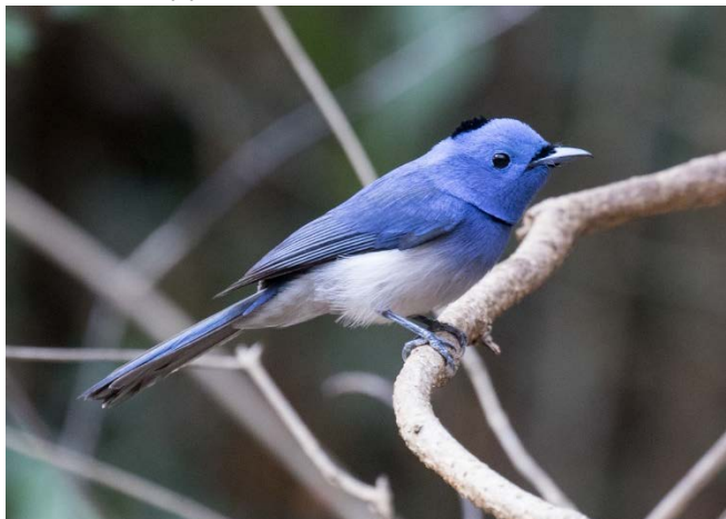
Svartnakkemonark, Baan Songnok

1 Baan Maka 16/02 2 Kaeng Krachan 17/02 2 Kaeng Krachan 18/02 2 Baan Songnok 19/02 1 Doi Inthanon 20/02