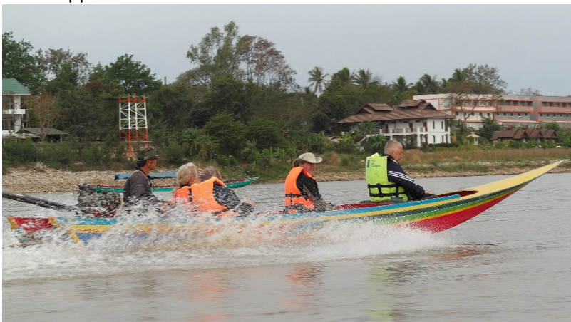
Båtrace på Mekong med Laos i bakgrunnen

Mekong – vi besøkte den «gyldne triangel», sjekket elvebreddene fra land og avsluttet med båttur på elva med en liten svipptur innom Laos