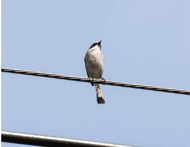
Jernskvett hann, Doi Inthanon