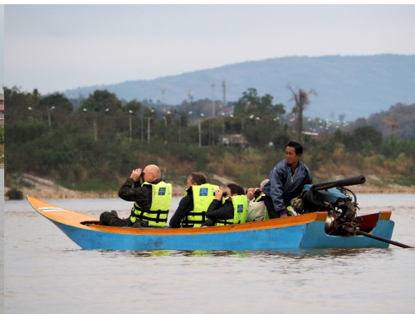
En stopp for å skanne elvebredden

Chiang Saen Lake – innsjø rett ved vårt overnattingssted Viang Yonok Hotel med flere dype armer, som best utforskes fra båt