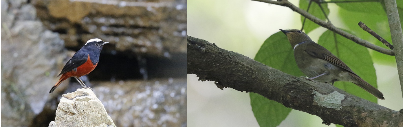
Strømrødstjert og rødbukniltava ved Baan Luang Resort