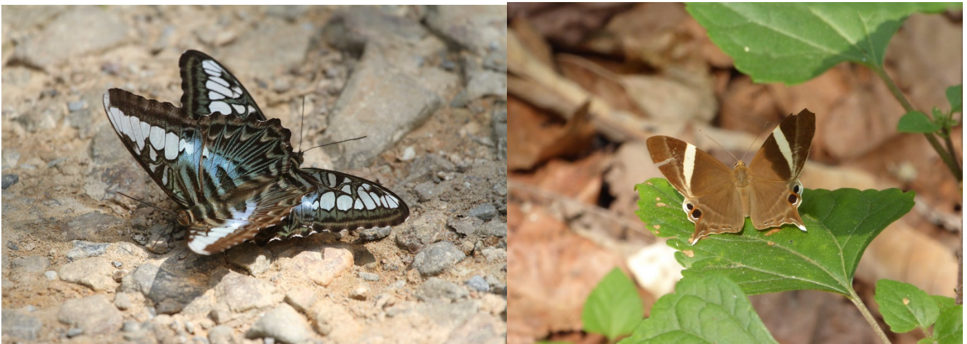
Kaeng Krachan er kjent for sine sommerfugler.