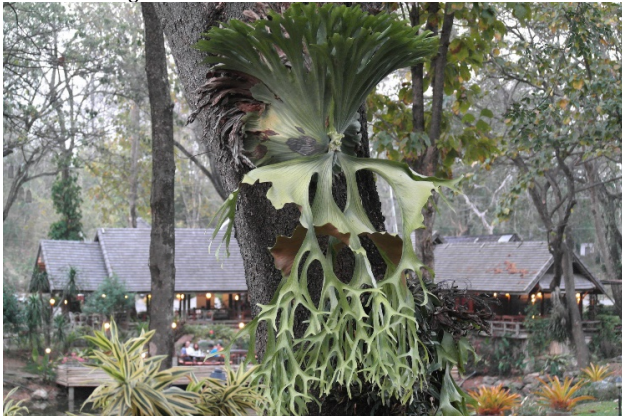
Highland Resort