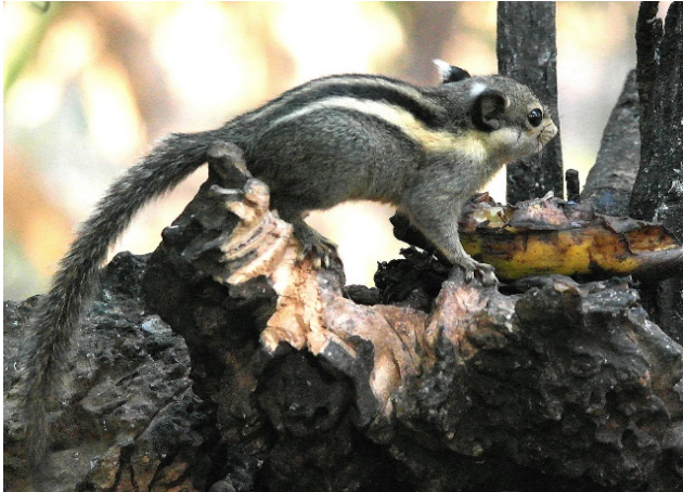
Three-striped Squirell

7 flere steder 16/02 2 Kaeng Krachan 17/02 3 Kaeng Krachan 18/02