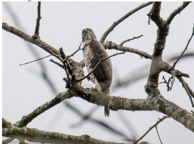
Topphawk, Kaeng Krachan

Topphawk Accipiter trivirgatus (Crested Goshawk) 1 Kaeng Krachan 17/02 1 Doi Inthanon 20/02 2 Doi Ang Khang 22/02 1 Doi Lang øst 24/02