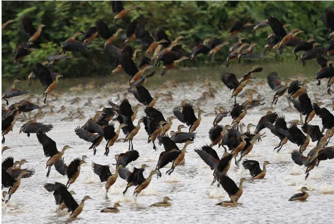
Småplystread, Chiang Saen

250 Laem Pak Bia 15/02 200 Wat Khao Takaro 16/02 2000 Chiang Saen Lake 25/02 40 Rismarker øst for Chiang Saen Lake 26/02 2000 Chiang Saen Lake 26/02 4000 Chiang Saen Lake 27/02