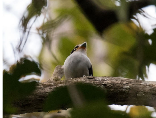
Sølvbrednebb, Kaeng Krachan