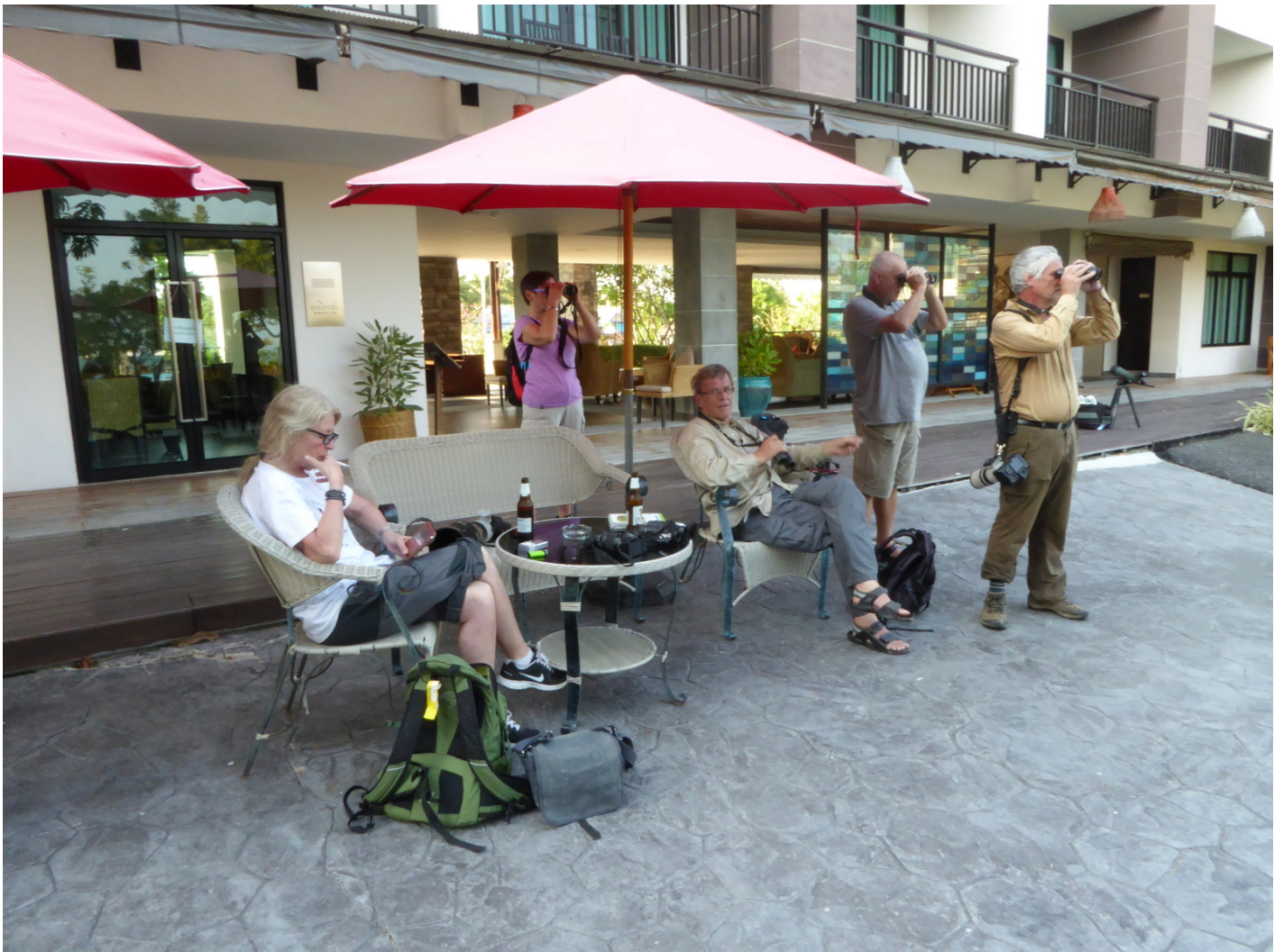
Her går det virkelig an å ha en stille stund kun avbrutt av en og annen spennende fugl