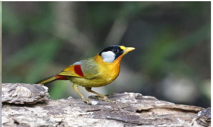
Sølvøretimal – Foto: Magne Myklebust