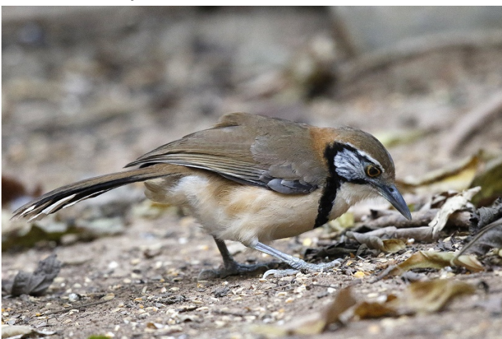
Kjedelattertrost, Baan Songnok

I dag skulle vi ha et par timer i fotoskjulet ved Baan Songnok med god tid til å rekke innenlandsfly fra den gamle hovedflyplassen Don Muang, Bangkok til Chiang Mai. Oppholdet i skjulet ble utrolig bra med en rekke nye turarter og flotte fotoforhold med lite lys om morgenen som gradvis ble bedre. Vi fikk se flere hønsefugler med kalifasan som høydepunktet. Vi fikk også studere lenkelattertrost og kjedelattertrost side om side. Artene er svært like som bildene under viser, men her kunne vi i ro og mak studere de side om side. Det var god plass til en gruppe på 10 personer og man kunne bevege seg mellom to forskjellige steder med innsyn. Dette ga en mulighet til å studere fuglene i ulike vinkler og ulike deler av foringa. Resten av hagen ved Baan Songnok var også rik på andre arter. Vi tenkte først at vi skulle være i skjulet til et noe etter 0900, men vi dro rundt 0845.