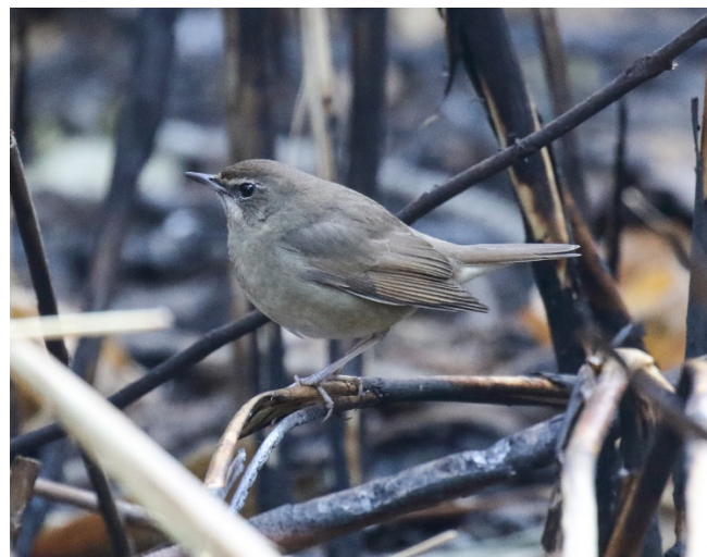
Rubinstrupe hunn, Doi Lang vest