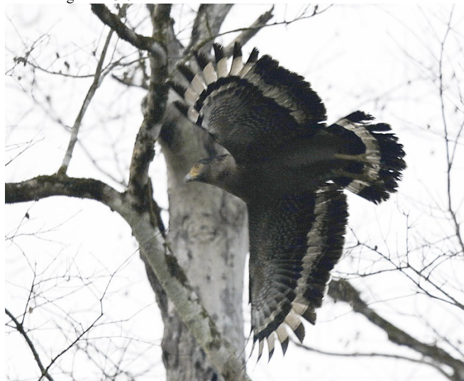
Orientsnokørn, Kaeng Krachan

Orientsnokørn Spilornis cheela (Crested Serpent-Eagle) 2 Kaeng Krachan 17/02 2 Kaeng Krachan 18/02 2 Huang Hong Krai 21/02 1 Doi Lang vest 23/02