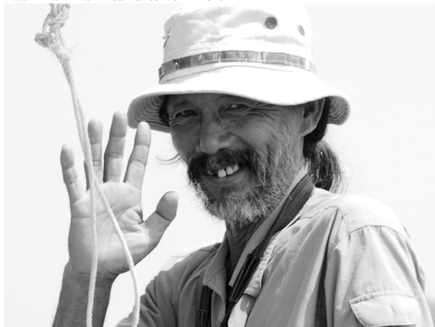
Flink kjentmann

250 Småplostreand Dendrocygna javanica (Lesser Whistling-Duck) 20 Bengalskarv Phalacrocorax fuscicollis (Indian Cormorant) 5 Orientaldivergskarv Phalacrocorax niger (Little Cormorant) 8 Gråhegre Ardea cinerea (Gray Heron) 10 Egretthegre Ardea alba (Great Egret) 30 Duskhegre Mesophox intermedia (Intermediate Egret) 4 Kritthegre Egretta eulophotes (Chinese Egret) 30 Silkehegre Egretta garzetta (Little Egret) 1 Sothege Egretta sacra (Pacific Reef-Heron) 1 Kuhegre Bubulcus ibis (Cattle Egret) Reg. Vinhegre Ardeola bacchus (Chinese Pond-Heron) Reg. Damhegre Ardeola speciosa (Javan Pond-Heron) 1 Shikra Accipiter badius (Shikra) 1 Braminglente Haliastur indus (Brahminy Kite) 1000 Stylteløper Himantopus himantopus (Black-winged Stilt) 15 Avosett Recurvirostra avosetta (Pied Avocet) 400 Tundralo Pluvialis squatarola (Black-bellied Plover) 40 Sibirlo Pluvialis fulva (Pacific Golden-Plover) 10 Brillevepe Vanellus indicus (Red-wattled Lapwing) 4000 Mongollo Charadrius mongolus (Lesser Sand-Plover) 6 Arkipello Charadrius peronii (Malaysian Plover) 300 Hvitbrystlo Charadrius alexandrinus (Kentish Plover) 10 Dverglo Charadrius dubius (Little Ringed Plover) 5 Strandsnipe Actitis hypoleucos (Common Sandpiper) 200 Sotsnipe Tringa erythropus (Spotted Redshank) 10 Gluttsnipe Tringa nebularia (Common Greenshank) 16 Sakhalinsnipe Tringa guttifer (Nordmann's Greenshank) 500 Damsnipe Tringa stagnatilis (Marsh Sandpiper) 10 Grønnstilk Tringa glareola (Wood Sandpiper)