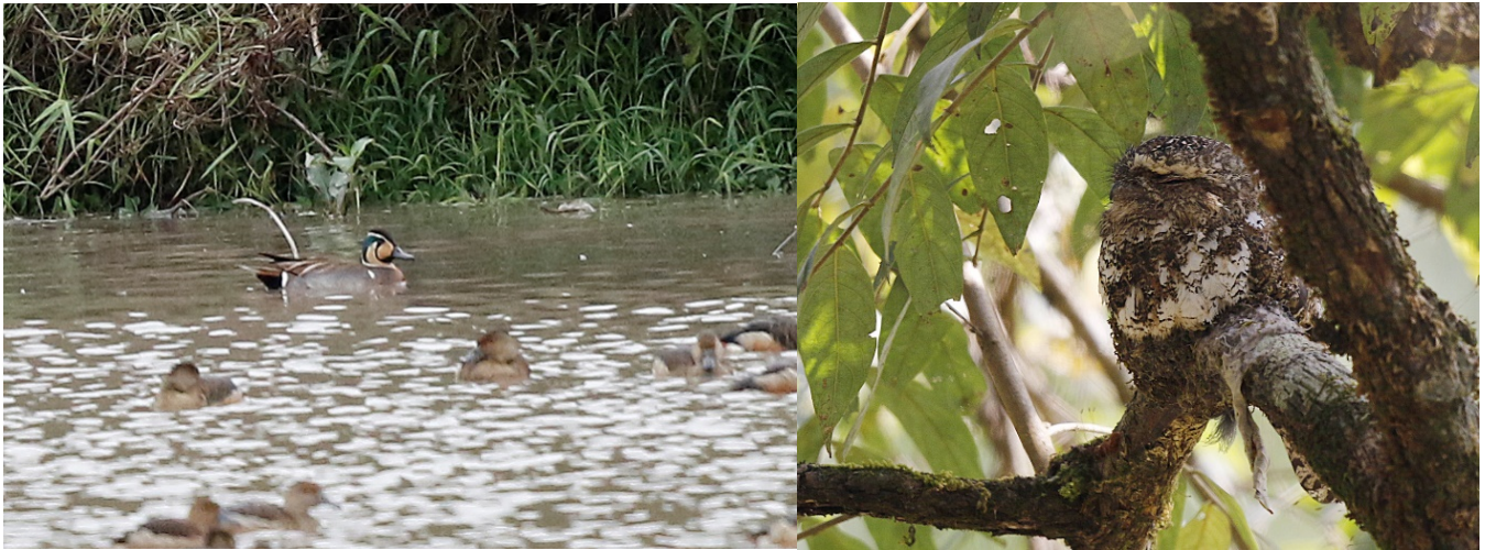
To uventede arter - gulkinndand og burmafroskemunn

Vi var en gruppe på 10 deltagere pluss 2 turledere som skulle utforske det sentrale og nordlige Thailand. Turen var lagt opp av de to turlederne med de fleste ideer og forslag fra Bengt. Vi hadde ei lang liste over arter vi håpet å finne, med skjesnipe som nummer en. Denne fant vi allerede dag en. Vi hadde ei lang liste over andre arter vi ønsket å finne, og vi dro i land de aller fleste. Noen bonusarter ble det også, som gulkinndand, lansettgrønndue, burmafroskemunn, ametystgjøk, karminbrystspett, praktstjertmeis, ildstrupe og blåhoderødstjert. Vi bommet på noen få arter, blant annet kjempespettmeis som vi kun hørte flere ganger. Vi klarte å finne hele 400 arter, hvor 5 kun ble sett eller hørt av Bengt. Antall arter må sies å være veldig bra.