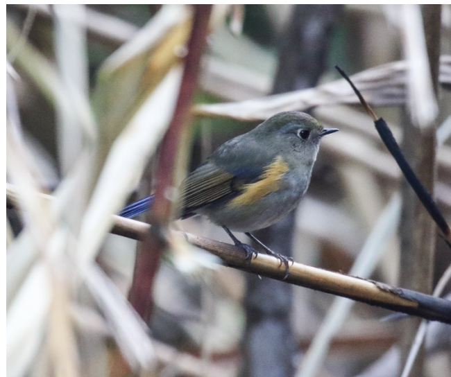
Himalayablåstjert, Doi Lang vest

1 hann Doi Lang vest 23/02 3 Doi Lang øst 24/02