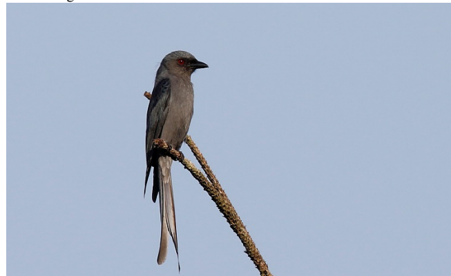
Askedrongo, Doi Ang Khang

5 Kaeng Krachan 17/02 100 Kaeng Krachan 18/02 1 Doi Inthanon 20/02 Reg. Doi Ang Khang 22/02 Reg. Doi Lang vest 23/02 5 Doi Lang øst 24/02