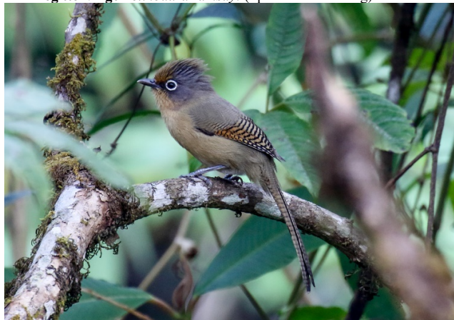
Brillegittervinge, Doi Lang øst