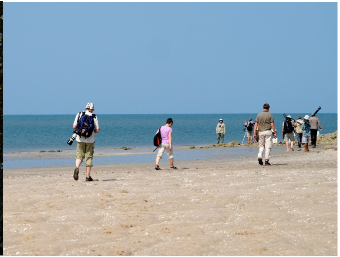
Ute på the Split måtte vi bevege oss til fots