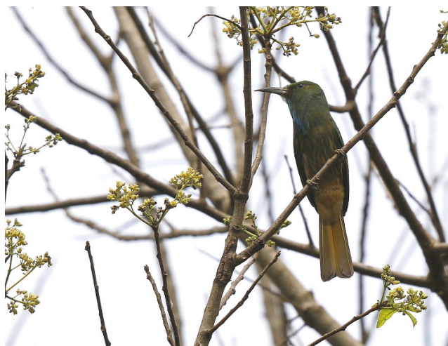
Blåskjeggbieter, Kaeng Krachan