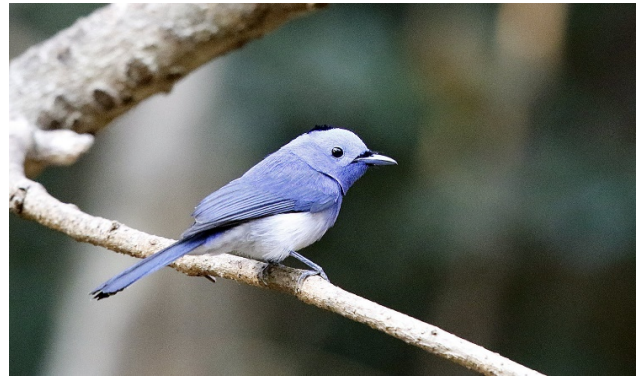
Svartnakkemonark – Foto: Magne Myklebust