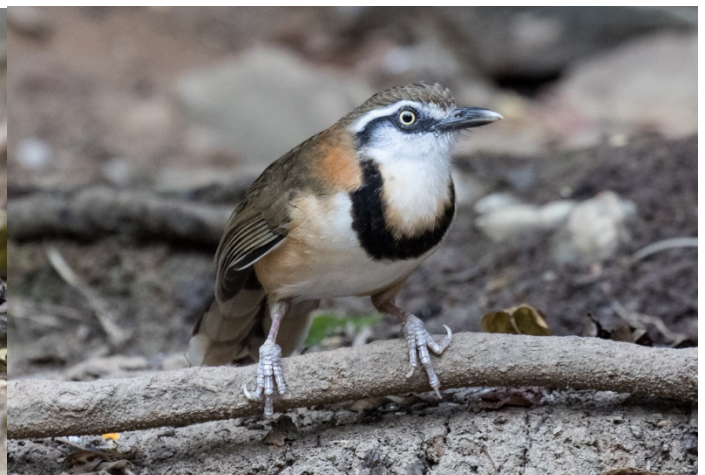
Lenkelattertrost, Baan Songnok