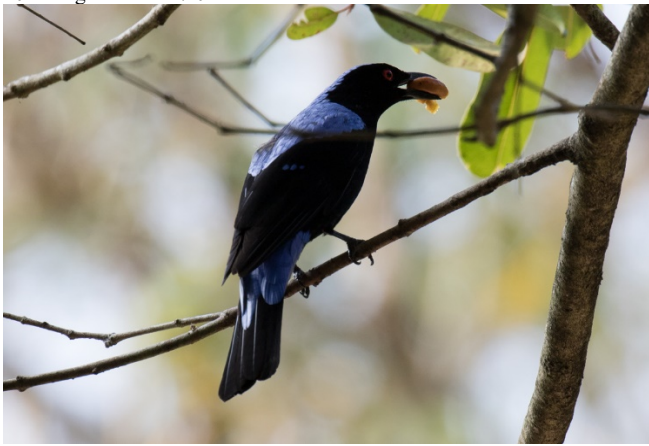
Blåalvefugl med daddel

Blåalvefugl Irena puella (Asian Fairy-bluebird) 10 Kaeng Krachan 17/02