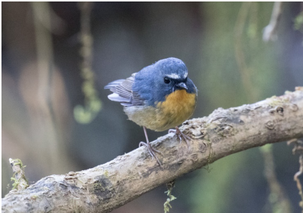
Auroraflyesnapper, Doi Inthanon