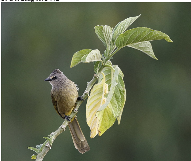
Gulstenkbylbyl, Doi Ang Khang

2 Kaeng Krachan 18/02 15 Doi Inthanon 20/02 20 Doi Ang Khang 22/02 Reg. Doi Lang vest 23/02 20 Doi Lang øst 24/02