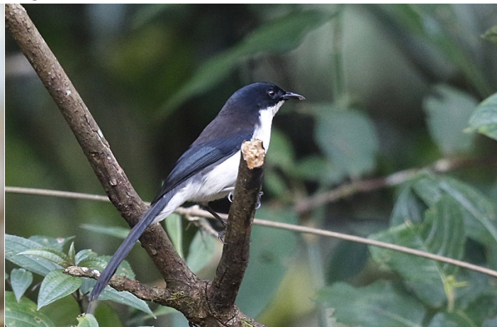
Gulvingelattertrost og mørkryggsibia, Doi Lang øst