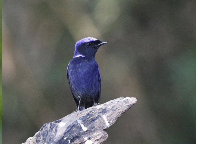
Storniltava – Foto: Magne Myklebust