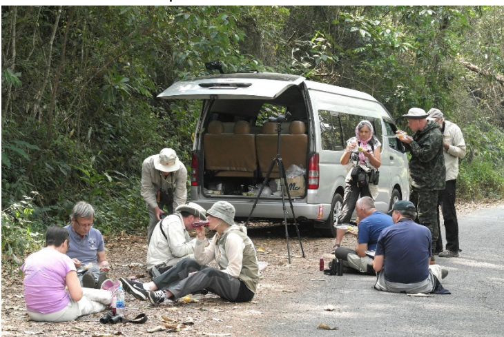
Lunsj i det fri på Doi Lang