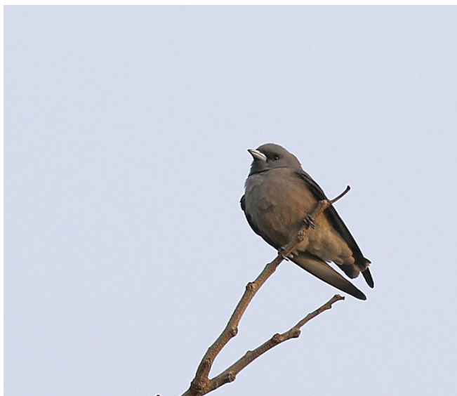
Askesvolestær, Baan Songnok – Foto: Magne Myklebust