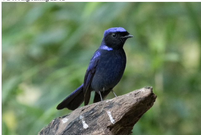
Storniltava, Doi Ang Khang

1 Doi Inthanon 20/02 4 Doi Ang Khang 22/02