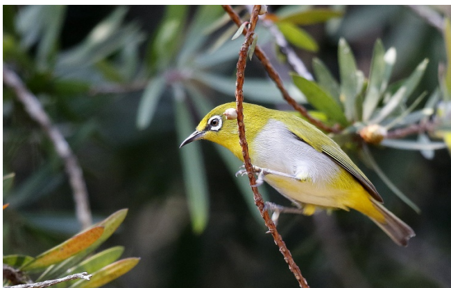
Lundbrillefugl, Doi Ang Khang

Hagebrillefugl Zosterops japonicus (Japanese White-eye) 20 Doi Ang Khang 22/02