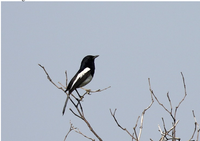
Orientskjæreskvett, Laem Pak Bia

Orientskjæreskvett Copsychus saularis (Oriental Magpie-Robin) 1 Bangkok til Nong Pla Lai 14/02 2 Nong Pla Lai 14/02 2 Laem Pak Bia 15/02 1 Kaeng Krachan 18/02 Reg. Baan Songnok 19/02 Reg. Baan Maka og veien 19/02 2 Doi Inthanon 20/02 5 Doi Ang Khang 22/02 3 Thaton rismarker 23/02 2 Doi Lang øst 24/02 2 Thaton rismarker 25/02 5 Chiang Saen Lake 25/02 5 Harrier roost 25/02 10 Rismarker øst for Chiang Saen Lake 26/02 5 Chiang Saen Lake 26/02