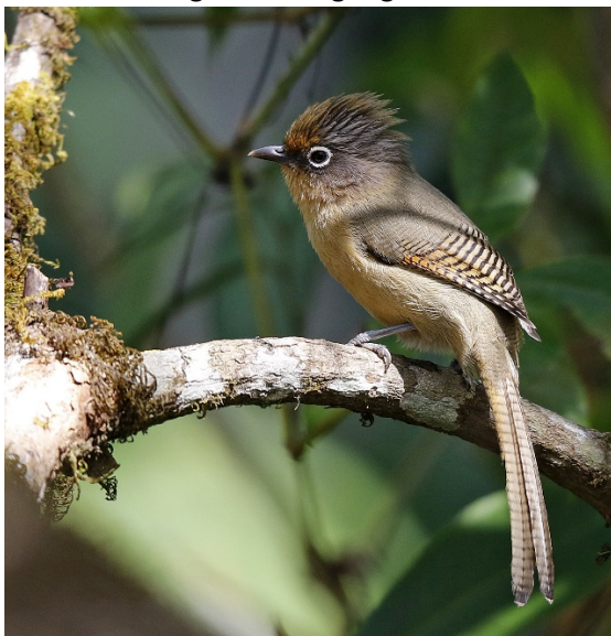
Brillegittervinge, Doi Lang øst

Flere gulvingelattertroster, mange mørkryggsibia, flere brillegittervinge og blåvingeminla. I området rundt fant vi også flere blåplystretrøst, himalayablåstjert, hvitbrynfluesnapper, taigafluesnapper, skiferrygfluesnapper og siratfluesnapper. Vi gikk en time nedover fra sjekkpunktet og fant blant annet en karminbrystspett som er endemisk for området og en uvanlig fugl å se.