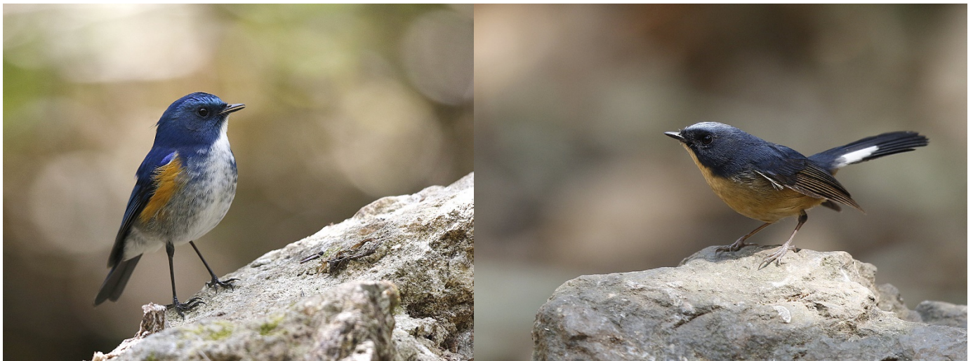
Himalayablåstjert og skiferryggfluesnapper, Doi Lang – Foto: Magne Myklebust

Tidlig frokost og medbragt lunsj for en hel dag på vestsiden av Doi Lang. Vi startet dagen med å lete etter burmafasan, men dessverre uten hell. Vi traff også vår danske venn som var ute med en lokal guide og de hadde også bommet på fasanen, men hadde sett flere kjempespettmeis. Vi kun hørte den. Ved flere av foringene var det god aktivitet, særlig av fluesnapper og småtroster.