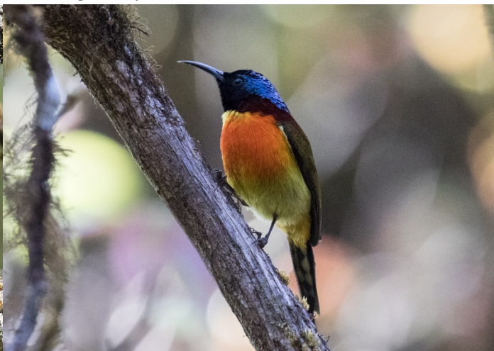
Purpurkronesolfugl, Doi Inthanon – Foto: Terje Axelsen

På toppen startet vi med kaffe for noen og bak kafeen ruststrupehøne og gulvingelattertrost for de aller fleste. Vi tok også turen langs plankeveien som går til en Buddha statue på toppen av fjellet, 2565 meter over havet. Det var lite fugl å finne her så vi satte kurs for sumpen på vestsiden av veien.