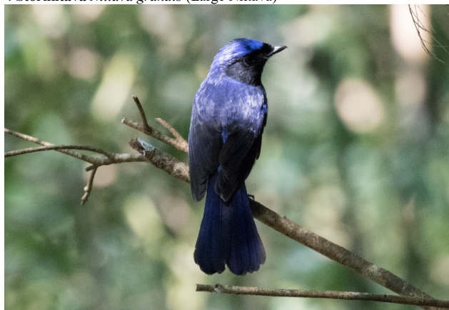
Storniltava, Doi Ang Khang – Foto: Terje Axelsen