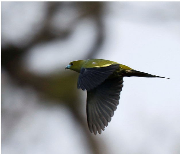
Lansettgrønndue, Doi Lang øst

Denne dagen ble brukt på østsiden av Doi Lang. Veien opp her er mildt sagt dårlig så vi hadde leid inn to biler med sjåfør. På grunn av dårlige rygger og sykdom, ble noen deltagere igjen ved hotellet. På denne siden av fjellet er det flere steder å stoppe ved før man kommer opp til øvre del. Første stopp var på ei bru over et dalsøkk med frodig skog på alle kanter. Her traff vi flere andre fuglefolk, blant annet australieren fra gårdsdagen. En rekke nye arter dukket også opp. Først et par kastanjespurv, en toppspurv og en svartbylbyl. Så kom 6 lansettgrønndue i full fart gjennom skogen og rett etter 3 nepaltaksvaler. Her var det en masse lyder rundt oss, mange gulstrupeskjeggfugl og en bampusspett for å nevne noen.