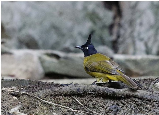
Svarttoppylbyl, Baan Songnok – Foto: Magne Myklebust