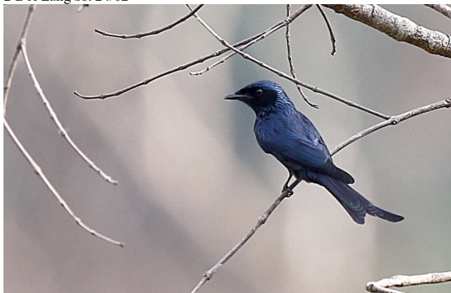
Bronsedrongo, Kaeng Krachan

4 Kaeng Krachan 17/02 5 Kaeng Krachan 18/02 3 Doi Inthanon 20/02 1 Doi Inthanon 21/02 2 Doi Lang øst 24/02