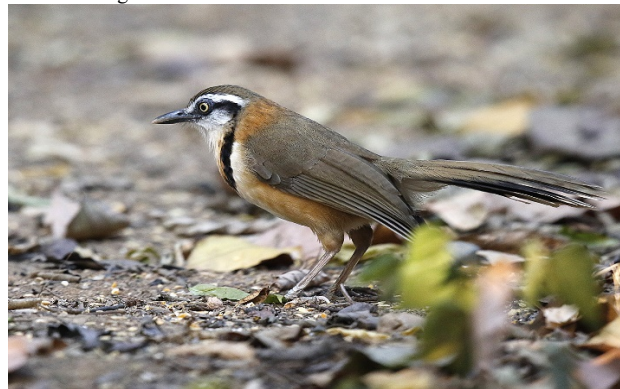
Lenkelattertrost, Baan Songnok

Kjedelattertrost Ianthocincla pectoralis (Greater Necklaced Laughingthrush) 5 Baan Songnok 19/02