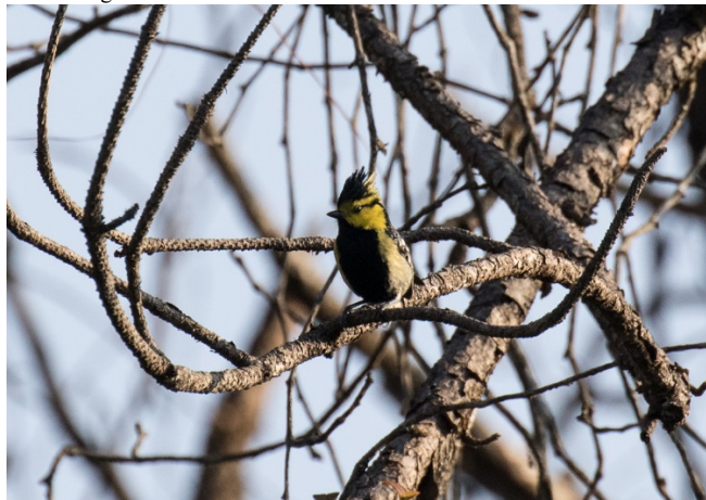
Gulkinmeis, Doi Ang Khang

10 Doi Inthanon 20/02 3 Doi Ang Khang 22/02 1 Doi Lang vest 23/02