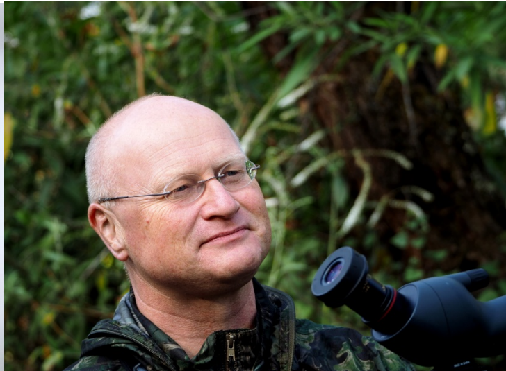
Peder på Doi Lang

Neste stopp var ved en helikopter landingsplass hvor det ofte er dvergspurv og andre buskspurver. Vi fant kun en liten flokk sibirpiplerker. Vi gjorde også en kort stopp ved en liten landsby med en del rismarker i ulike stadier. Her fant vi ei krabbehegre, en rastende gråkinnvåk, en jaktende shikrahauk, et par syngende orientpiplerker, en rastende rustvarsler og en rastende tefravsler.