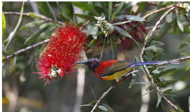
Purpurkronesolfugl, Doi Ang Khang

6 Doi Inthanon 20/02 10 Doi Ang Khang 22/02 2 Doi Lang vest 23/02 5 Doi Lang øst 24/02