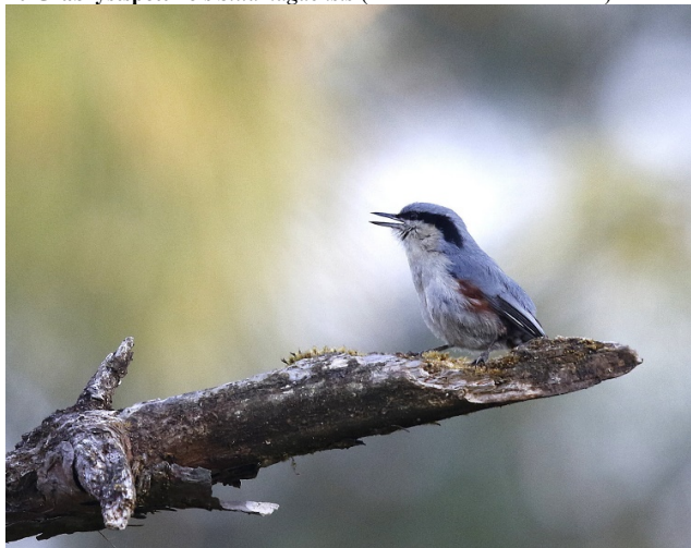
Gråbrystspettmeis, Doi Ang Khang