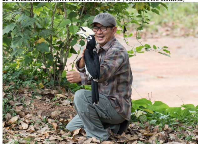
Orienthornfugl, Kaeng Krachan