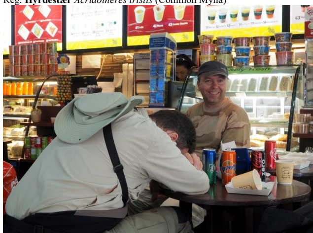
Noen var syke og noen var friske på vei mot nord