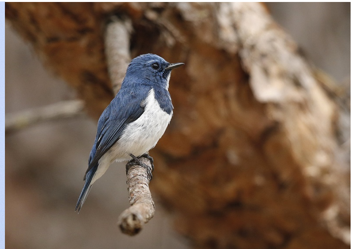
Fjellskogørn og ultramarinfluesnapper, Doi Lang vest