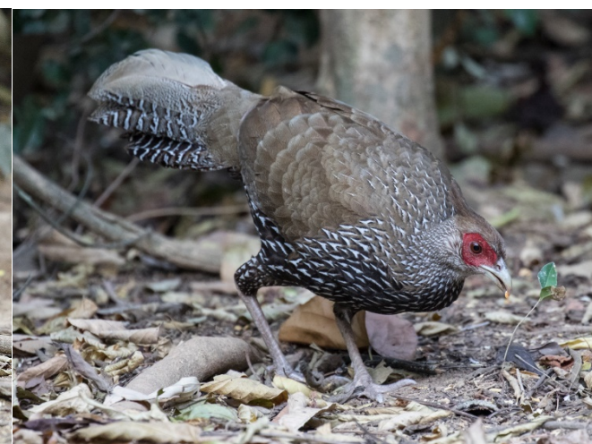
Kalifasan, hunn, Baan Songnok – Foto: Terje Axelsen

Turen til flyplassen tar normalt 2,5 timer. Så vi skulle ha vært på flyplassen 1115 for et fly som skulle dra 1345. Det skjedde dessverre ikke. Jeg satt ved siden av sjåføren i minibussen som følte seg nokså komfortabel, helt til vi møtte den første køen. Jeg overdriver ikke hvis jeg sier at min mor på 80+ hadde vært en kilometer foran oss til fots etter den første timen. Hun hadde trolig vært foran oss også etter den andre timen. Vår sjåfør som før dette hadde vært fantastisk, jobbet hardt med en GPS for å finne alternative ruter, men det var rødt over alt. Dette kunne ikke gå bra og det gjorde det ikke. Vi parkerte foran Terminal 1 på Don Muang Airport klokken 1344, et minutt før flyavgang. De som skulle hente Bengt's leiebil hadde heller ikke kommet og satt fremdeles fast i den utrolig tette trafikken. Vi skulle fly til Chiang Mai med Air Asia, men de hadde ikke ledige seter før neste dag 1530. Heldigvis fant vi ledige plasser hos NOK Air i terminal 2 med avgang 1630, yippi. Dette medførte at vi ankom Chiang Mai svært seint og var først framme ved hotellet ved Doi Inthanon rett før 2000. Kjøkkenet var stengt, så vi måtte kjøre noen kilometer før vi fant et åpent spisested. Dette var en fredagskveld så det var mye mennesker ute, men vi fant et sted hvor det var plass til alle.