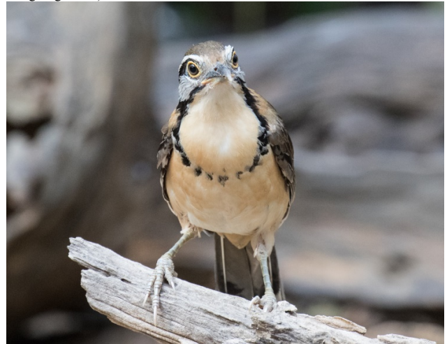
Kjedelattertrost, Baan Songnok