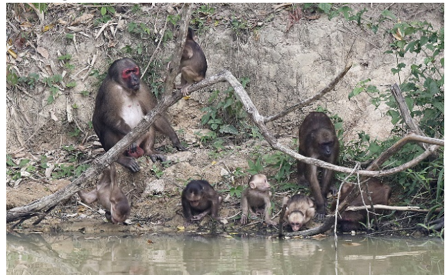
Stub-tailed Macaque