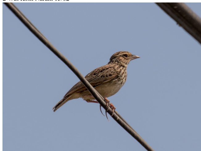
Orientlerke, Laem Pak Bia

1 Laem Pak Bia 15/02 2 Wat Kom Naram 15/02