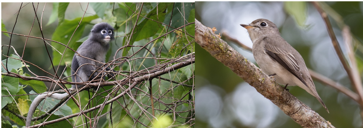
Dusky Langur og brunfluesnapper – var begge ved besøksenteret i parken