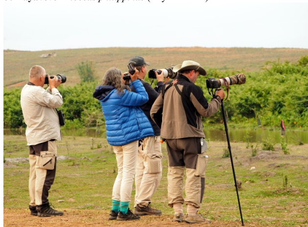
Fra kjerrhaukplassen