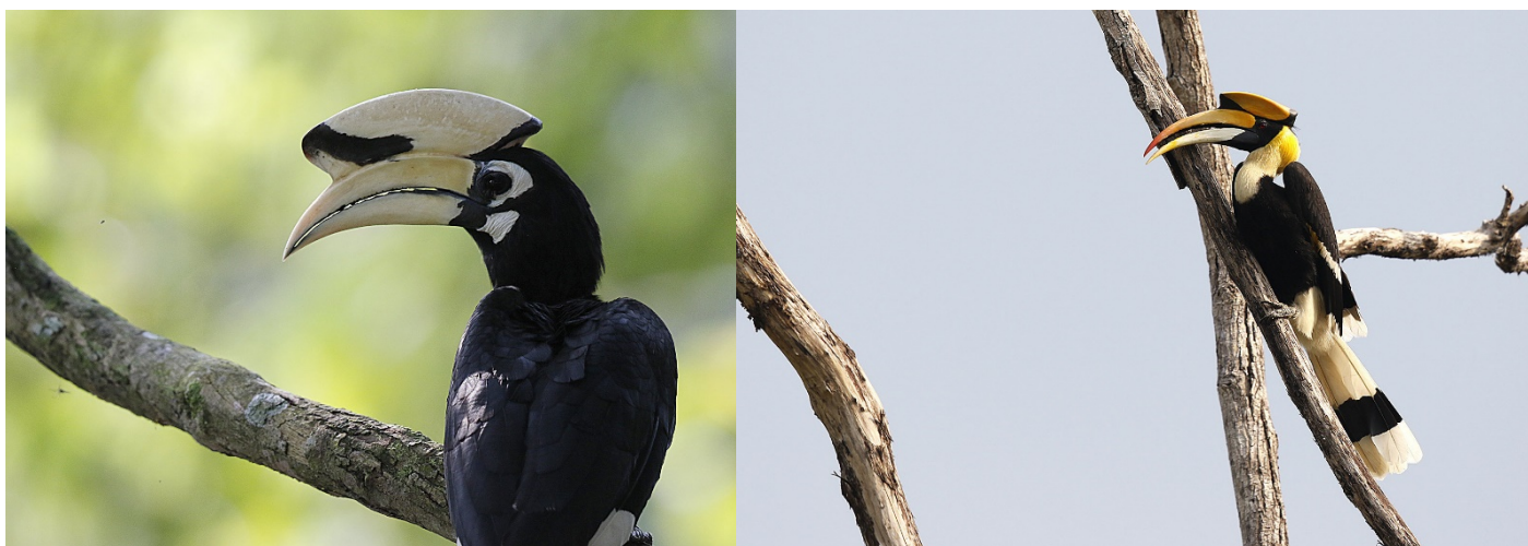
Orienthornfugl og storhornfugl i Kaeng Krachan