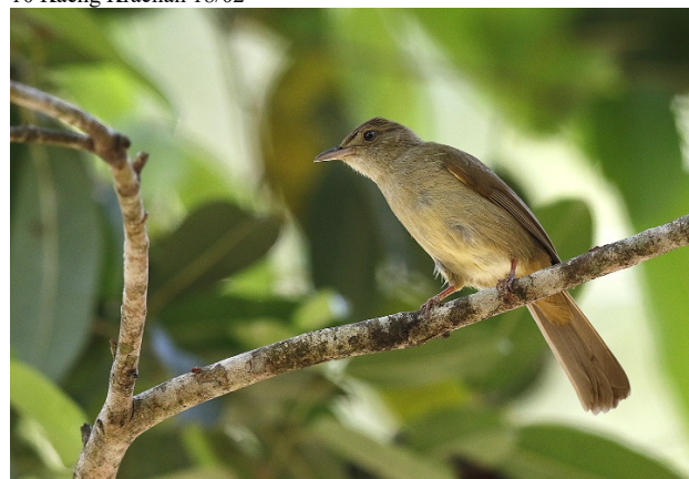
Okerbylbyl – Foto: Magne Myklebust

30 Kaeng Krachan 17/02 10 Kaeng Krachan 18/02