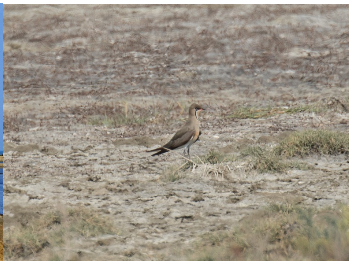
Orientbrakksvale Wat Kom Naram

Lunsj ble servert hos vertskapet som senere tok oss ut elva til the Split. Nok en gang smakfull mat. Båtturen ut til sandbankene ved elvemunningen ble en flott tur. Masse mennesker arbeidet med å finne mat i sjøen ute ved elvemunningen, mens vi fort fant arkipello, steppemåke, samojedmåke og turens eneste bengalterne. Litt senere fant vi også flere «White-fronted Plover». Av mange betraktet som en underart eller variant av hvitbrystlo, mens like mange mener at disse fuglene fortjener full artsstatus.