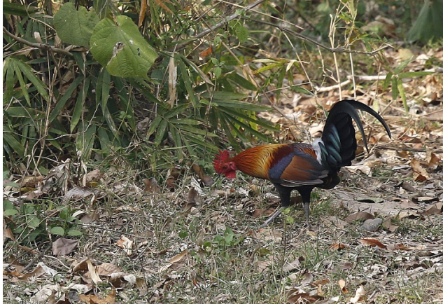
Bankivahane (ja den er vill)