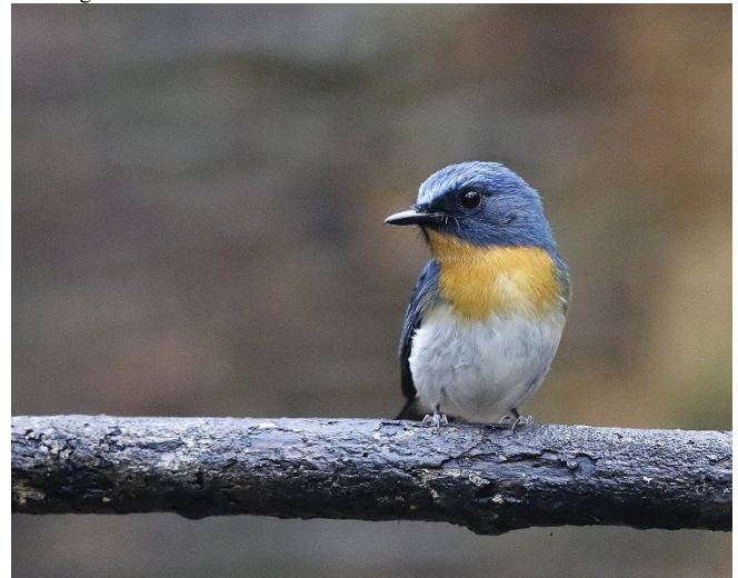
Buskfluesnapper, Baan Maka

Buskfluesnapper Cyornis tickelliae (Tickell's Blue-Flycatcher) 3 Baan Maka 16/02 1 Kaeng Krachan 18/02