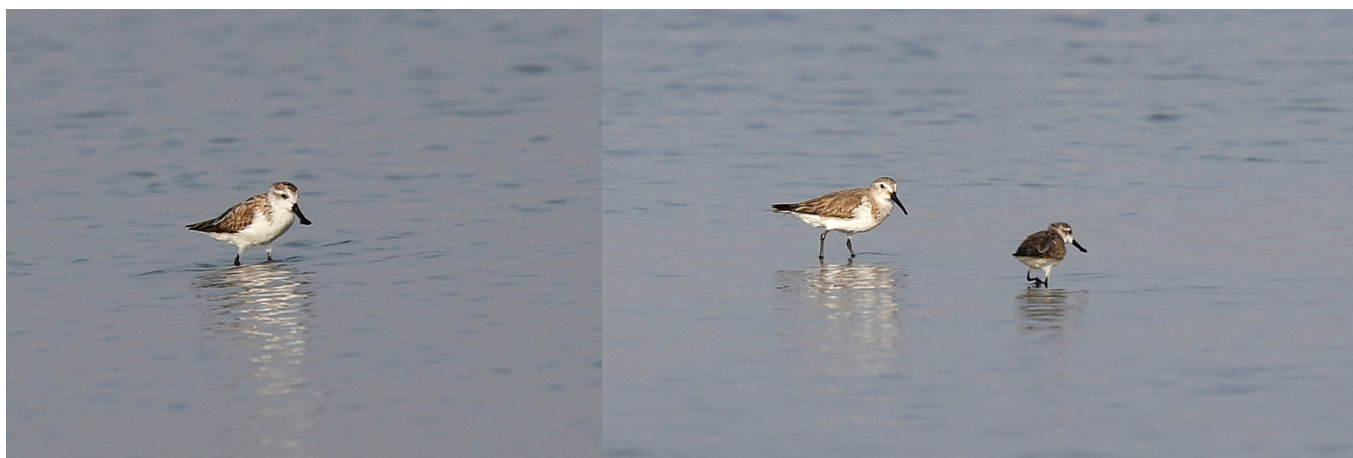
Skjesnipe til venstre og tundrasnipe med skjesnipe til høyre

Vi dro så videre til Pak Thale for å finne skjesnipe. Det var ikke lagt ut informasjon om arten de siste dagene, men det tok oss ikke alt for lang tid å finne to fugler. Den ene fuglen var fargemerket, trolig gjort av britiske ringmerkere på Kamtsjatka. Masse andre vadefugler ble også observert her. Vi traff også to svært hyggelige danske ornitologer som vi skulle treffe nesten daglig den neste uka. Vi utvekslet informasjon med de og jeg tror begge parter dro nytte av dette samarbeidet.