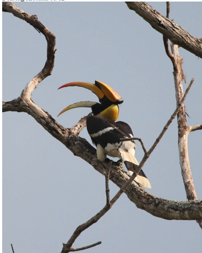
Storhornfugl i Kaeng Krachan

3 Kaeng Krachan 17/02 2 Kaeng Krachan 18/02