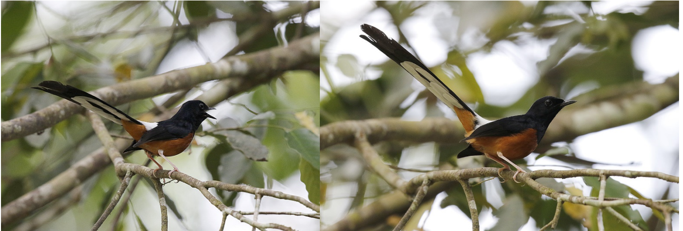
Arieshama Kaeng Krachan