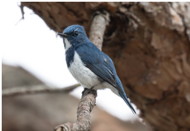
Ultramarinfluesnapper, Doi Lang vest – Foto: Terje Axelsen

Ultramarinfluesnapper Ficedula superciliaris (Ultramarine Flycatcher) 1 hann Doi Lang vest 23/02