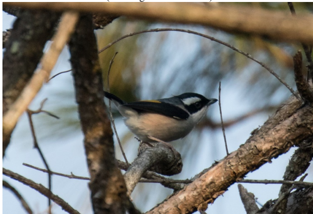
Clicking Shrike-Babbler, Doi Ang Khang – Foto: Terje Axelsen