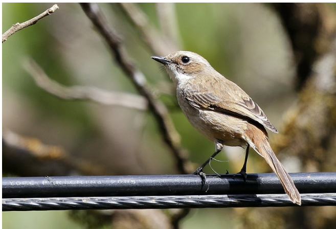
Jernskvett hunn, Doi Inthanon