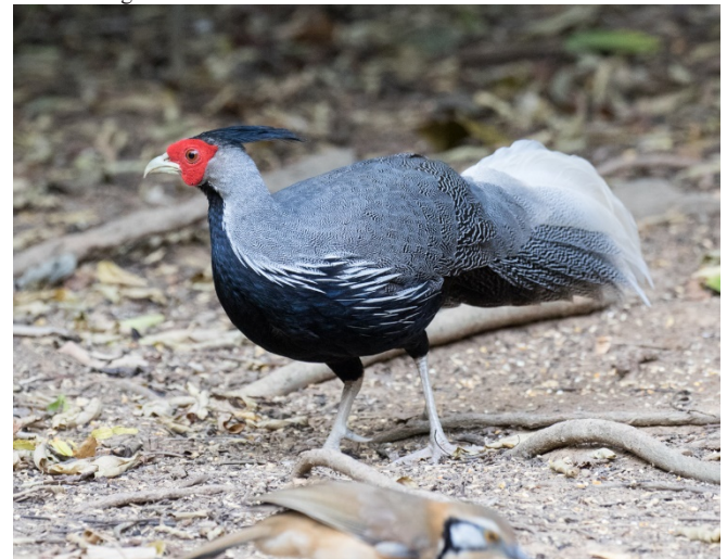
Kalifasan, Baan Songnok

1 hann og 2 hunner Kaeng Krachan 18/02 2 Baan Songnok 19/02