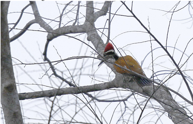
Protevspett, Baan Maka

2 Baan Maka 16/02 1 hort Baan Songnok 19/02