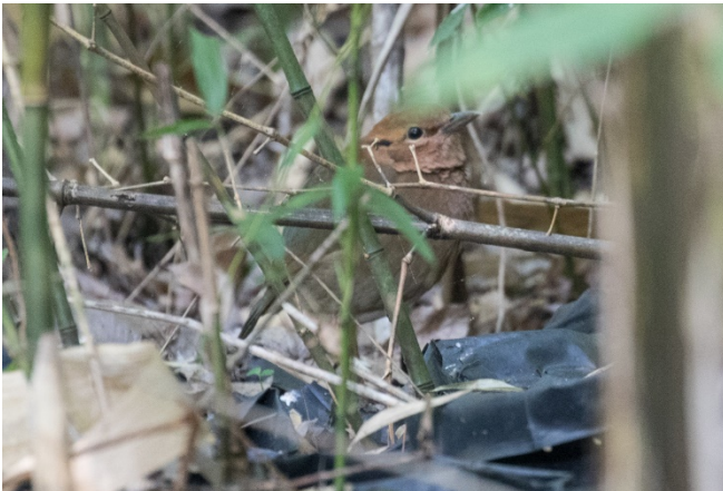
En utrolig godt kamouflert aprikospitta

Nok en fantastisk dag. Vi reiste tidlig fra hotellet opp de bratte bakene til Doi Ang Khang. Bakkene er utrolig bratte og svingene meget skarpe. Det er skiltet at man skal tute på veien opp og ned for å varsle andre trafikanter. Vi forsøkte først å finne burmafasan, uten hell. Deretter forsøkte vi å lokke på kjempespettmeis, men fikk bare et par svar langt unna. Vi fant godt med fugler ved den militære checkpointen før vi fortsatte opp mot Dronningens Prosjekt. Det blåste godt og det var ganske kjølig. Vinden la også en demper på en del av fuglesangen. En kort stopp i tykk skog ga ei gruppe sølvøretimaler, flere østsangere og rosenfinker. Et av dagens hovedmål var Dronningens prosjekt. Dronningens Prosjekt er nesten som en botanisk hage med en god restaurant i midten. Lokale stammer har fått betalt for å dyrke grønsaker og annet i stedet for opium, mye av dette kunne vi se inne i prosjektet. Vi kjørte først rett gjennom prosjektet til ei foring på baksiden. Her satt allerede vår danske venn. Han pekte ut en aprikospitta som var utrolig godt kamouflert på bakken. Dessverre fikk langt fra alle våre deltagere se denne før den spaserte vekk. Allikevel var det utrolig mye annet å fokusere på.