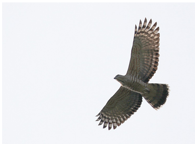
Topphawk, Kaeng Krachan

Shikrahauk Accipiter badius (Shikra) 1 Laem Pak Bia 15/02 1 Kaeng Krachan 17/02 1 Doi Lang øst 24/02