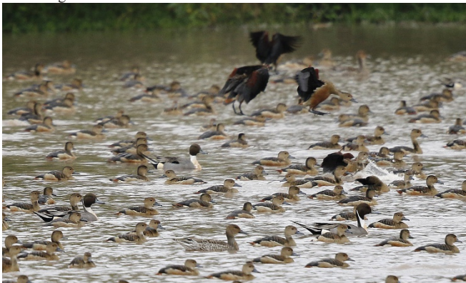
Stjertender blant plystreender, Chiang Saen

30 Wat Khao Takaro 16/02 80 Chiang Saen Lake 26/02