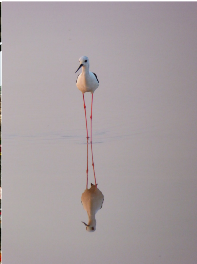
Stylteløper var vanlig ved dammene

Antall arter denne dagen: 108 - som skulle bli det høyeste antallet på hele turen