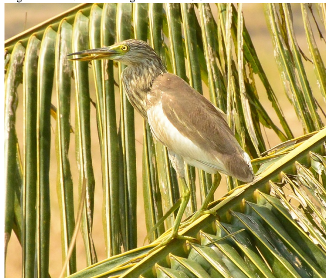
Trolig vinhegre – Foto: Anne Hopstock

Reg. Rismarker øst for Chiang Saen Lake 26/02