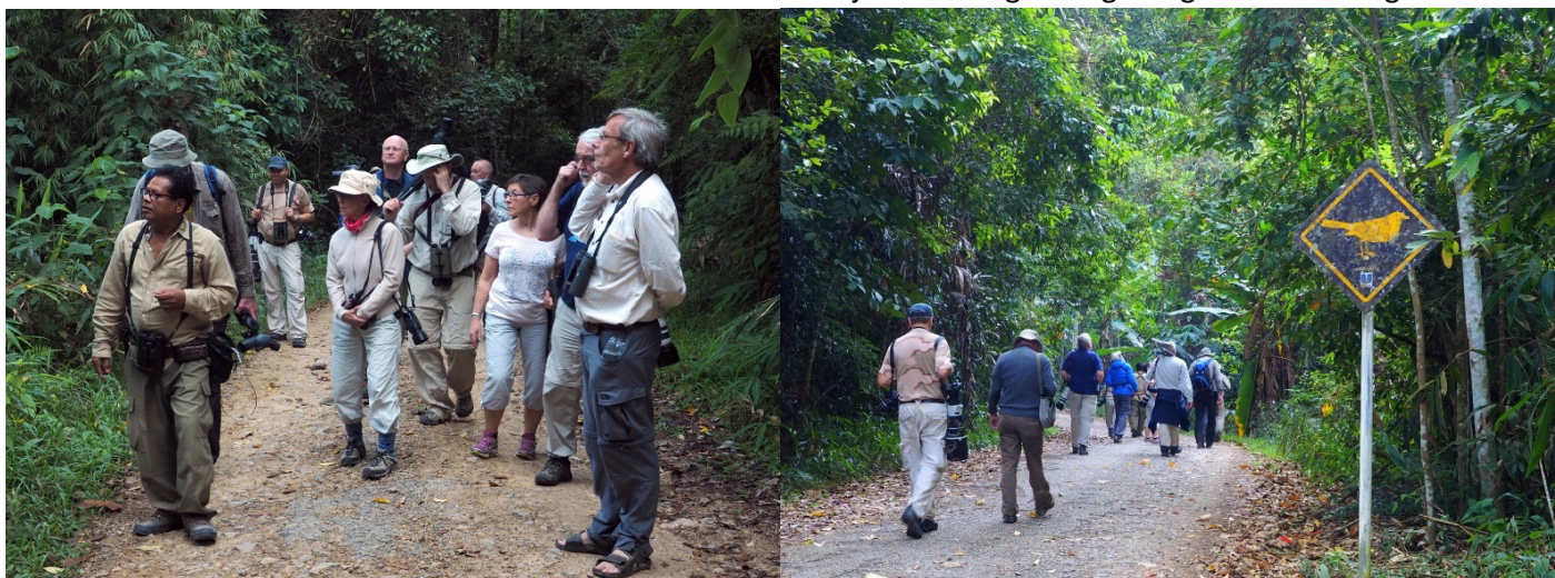
Lokalguiden vår fungerte veldig bra. Skogen i Kaeng Krachan er nesten urørt

Denne dagen dro vi opp i øvre del av Kaeng Krachan. Veien opp er av mildt sagt dårlig kvalitet så vi måtte leie inn en bil ettersom bussen vår ikke kunne klare veien. Vi fikk bil med sjåfør som også fungerte godt som lokal guide.