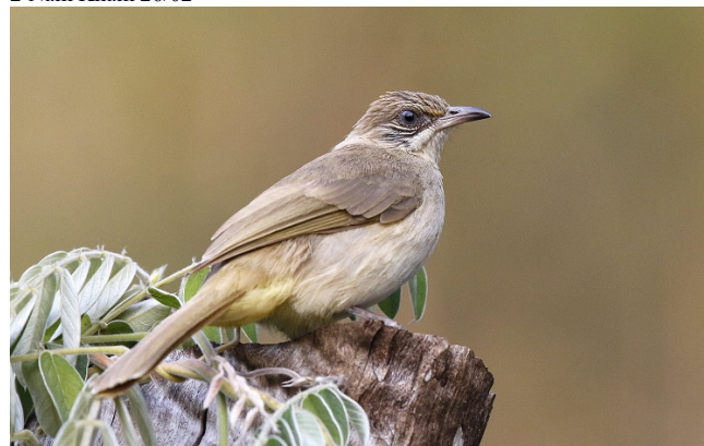
Strekørebylbyl, Baan Songnok

5 Pak Thale 15/02 5 Laem Pak Bia 15/02 1 Wat Kom Naram 15/02 10 Wat Khao Takaro 16/02 5 Baan Maka 16/02 4 Kaeng Krachan 17/02 10 Baan Maka 17/02 2 Nam Kham 26/02