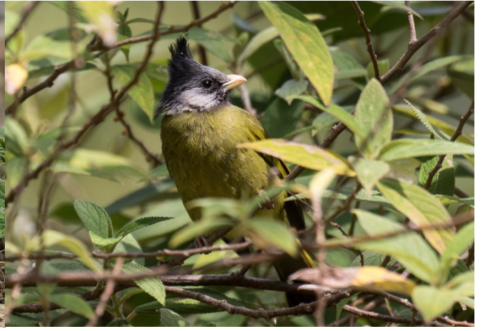
Toppfinkebylbyl, Doi Lang, vest