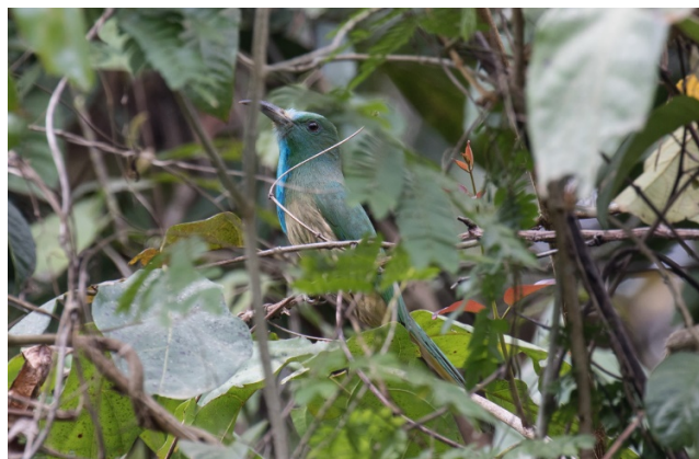
Blåskjeggbieter, Kaeng Krachan