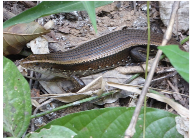
Skink sp.