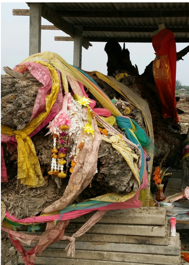
Den hellige stokken