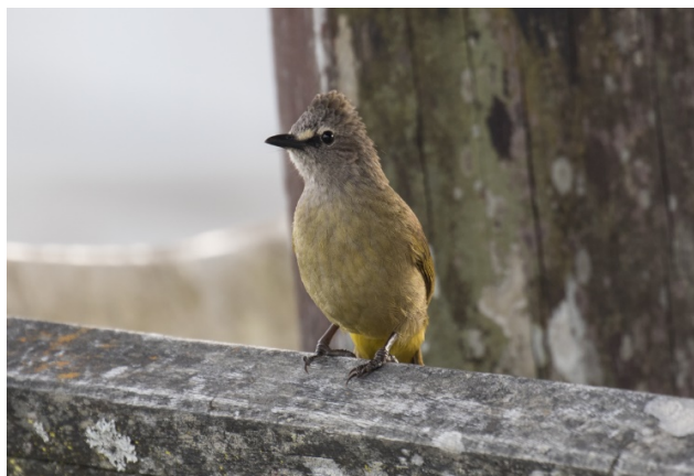
Gulstenkbylbyl, Doi Ang Khang – Foto: Terje Axelsen