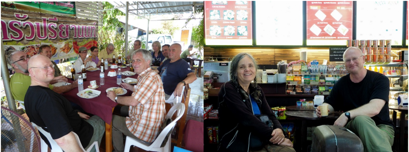
Første lunsj etter at skjesnipa var i havn

Maten var utrolig god, både variert og god i smak. Frokost ble servert fra 0530 til 0800 alt etter hva slags avtaler vi klarte å få til med overnattingsstedene. Stekt egg var en gjenganger. Lunsj ble ofte spist langs veien eller medbragt fra hotellet. Middag ble som regel spist ved overnattingsstedet, men vi besøkte også noen enkle gode spisesteder utenfor hotellene. Maten var tilpasset vestlige ganer, slik at vi fikk mat som var passe krydret for oss. Innkvarteringen varierte fra 4-stjerners hotell de to første nettene til nokså enkle rom flere steder i nord. Selv om innkvarteringen var enkel var renholdet svært godt.