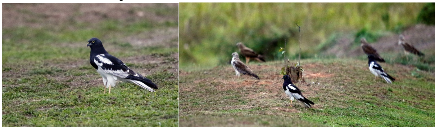
Praktkjerrhauker på rasteplass ved Chiang Saen – Foto: Magne Myklebust

Etter å ha sjekket inn dro vi på en liten turisttur til «Den Gylne Triangel». Jeg besøkte stedet første gang i 1987 og da var det kun noen skur der, et par tesalonger hvor man røykte noe annet enn tobakk og noen få spisesteder. I dag er det dessverre, men naturlig nok, en stor turistindustri knyttet til området. Alle fikk uansett opplevd stedet som alle hadde lest eller hørt om. Vi fant jammen meg også en ny turart der, hvitgumpnonne. Etter dette dro vi tilbake til hotellet og skiftet tøy for å være ute om kvelden. Vi skannet sjøen og fant flere nye turarter samt rundt 2000 småplystreand. Da vi dro videre mot rasteplassen for kjerrhauker fant vi store mengder vannfugler. Vi fant over 500 sultanhøner og turens eneste vipphalesanger og en hærfugl. Etter det handlet alt om kjerrhauker og spesielt praktkjerrhauk. Hvor kommer alle fuglene fra? Vi hadde rundt 200 fugler i vårt område og det finnes minst to andre rasteplasser. Man tror fuglene kommer fra et stort område, fra Laos Myanmar og Thailand. Det merkelige er at fuglene kom ned i løpet av en time, satt på bakken i 15-20 minutter for så å ta til vingene og forsvinne. For meg var dette et de mest magiske øyeblikk på hele turen (og vi hadde virkelig mange slike øyeblikk). Jeg tror og håper det var det samme for flere av turdeltagerne.