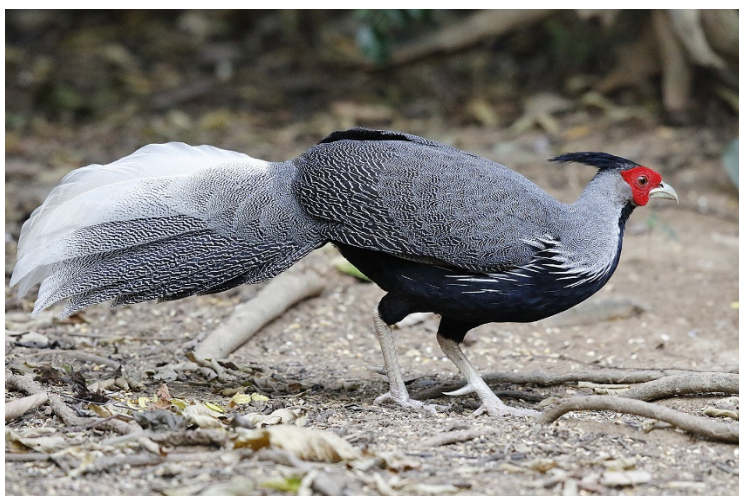
Kalifasan hann, Baan Songnok