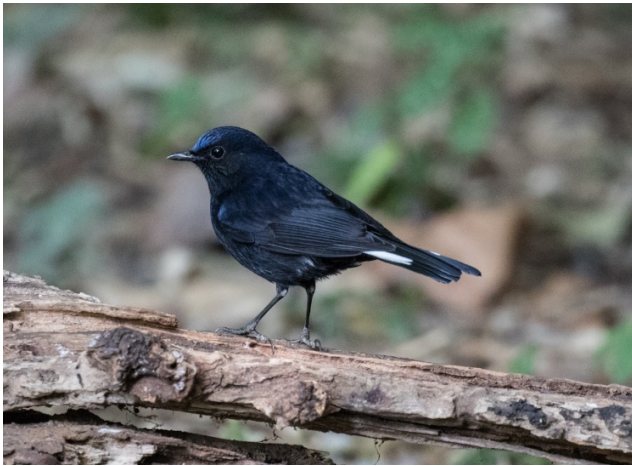
Hvitaleskvett – Foto: Terje Axelsen