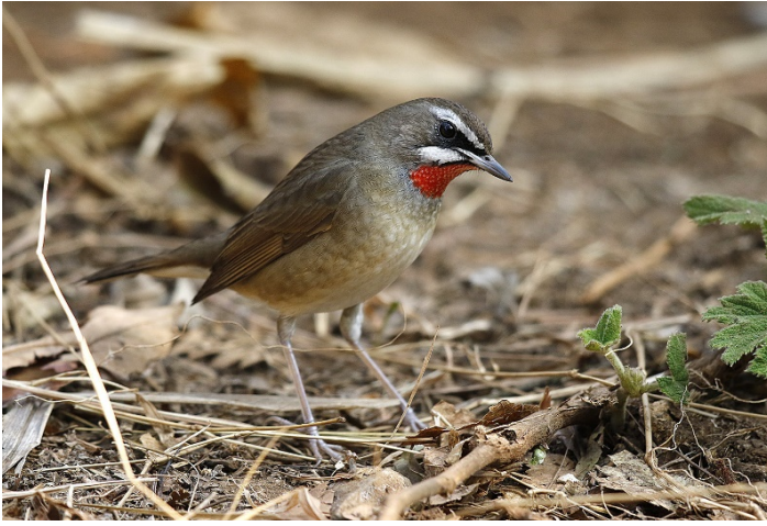
Rubinstrupe, Doi Lang, vest – Foto: Magne Myklebust