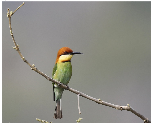
Bengalbieter, Doi Inthanon