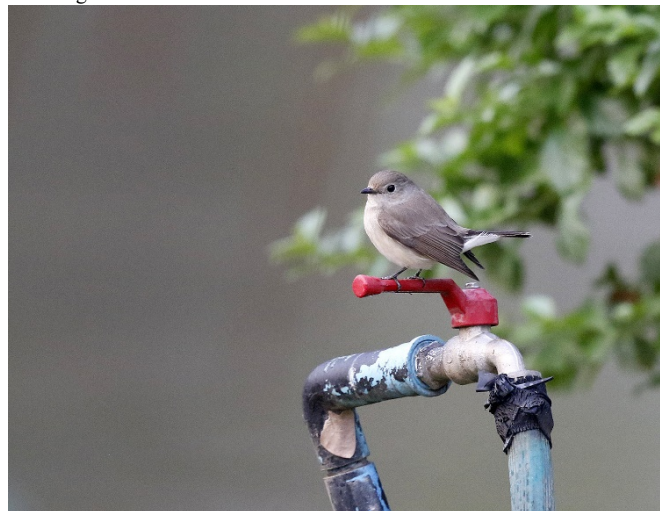
Taigafluesnapper, Doi Inthanon

7 Kaeng Krachan 17/02 1 Kaeng Krachan 18/02 3 Baan Songnok 19/02 4 Doi Inthanon 20/02 3 Doi Inthanon 21/02 3 Huang Hong Krai 21/02 5 Doi Ang Khang 22/02 7 Doi Lang vest 23/02 5 Doi Lang øst 24/02 1 Thaton rismarker 25/02 2 Chiang Saen Lake 25/02 2 Nam Kham 26/02 2 Chiang Saen Lake 26/02