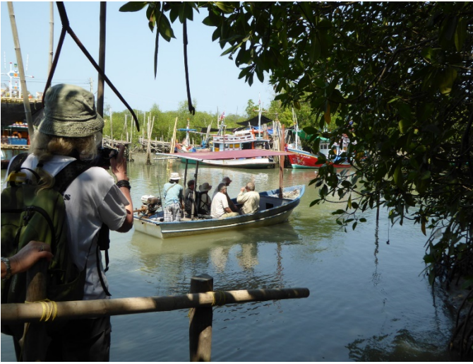
Vi brukt to båter ut til the Split - Foto: Heidi Lillehammer