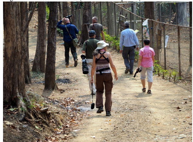
På letting etter smaragd påfugl