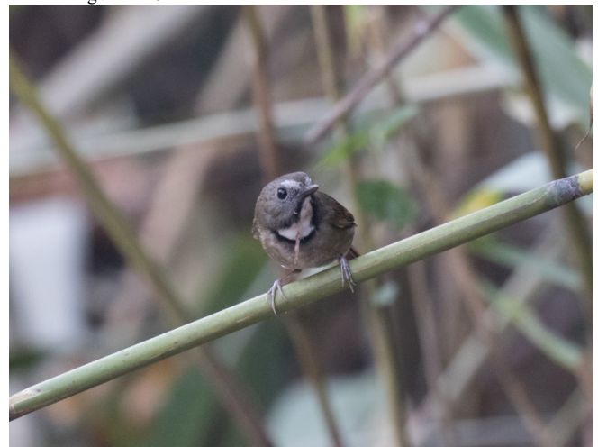
Prydfluesnapper, Doi Lang vest

Prydfluesnapper Anthipes monileger (White-gorgeted Flycatcher) 3 Doi Lang vest 23/02 1 Doi Lang øst 24/02