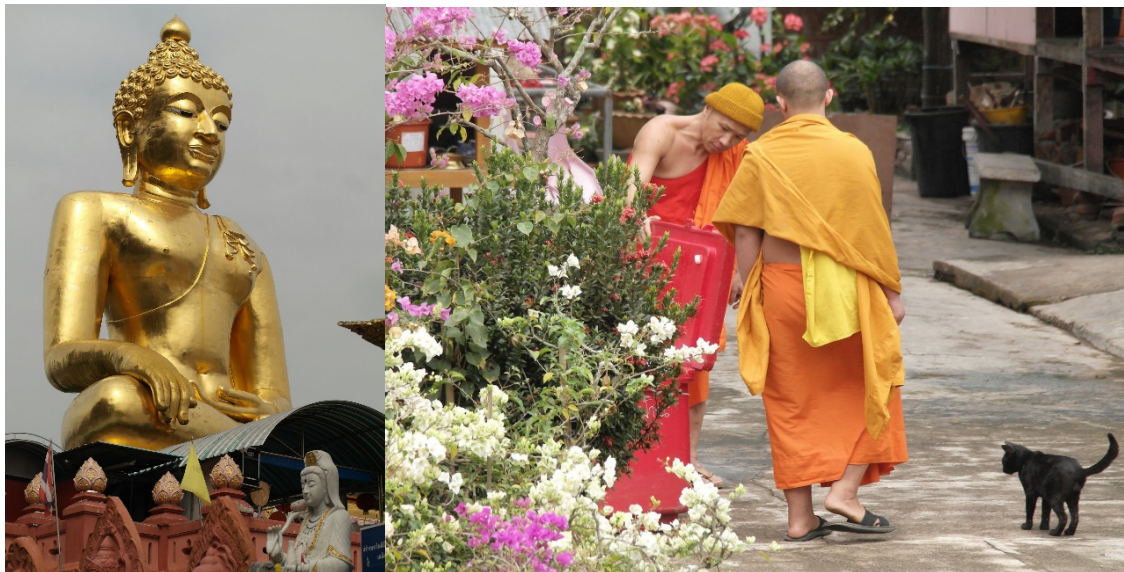
Buddha figur ved den gylne triangel og buddhistiske munke i Chiang Saen

Vi reiste videre til vårt neste overnattingsted, Viang Yonok Hotel. Kanskje det beste stedet vi bodde på hele turen. Maten var fantastisk, både frokost og middag og vertskapet helt spesielt. Jeg har bodd der før og reiser tilbake når som helst. Stedet ligger ved bredden av Chiang Saen Lake.