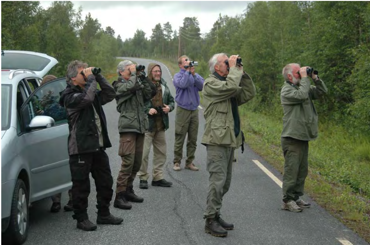
En nyutfløyen haukugleunge studeres ved Vaggatem, Sør-Varanger - © M. Günther.

Pasvikdalen strekker seg omlag 100 km sørover og ligger som en kile mellom Russland og Finland. Området er viden kjent for sin spesielle flora og fauna med innslag av østlige arter, og for å huse Norges største bjørnestamme. I løpet av de to dagene (og nettene) vi hadde til rådighet besøkte vi en rekke våtmarkslokaliteter langs Pasvikelva inkludert Skrøytnesmyra, Lille Skogøy, Noatun, Nyrud og Hestefosdammen. Noen bjørn fant vi ikke, men derimot en lang rekke spennende fugler inkludert sangsvaner, sædgjess, en hvitkinngås, skjeender, et trettitalls lappfiskender, sotsnipper, temmincksnipe, trane, sidensvans, blåstrupe, rødstjert, sivsanger og konglebit. Vi hadde også drøyt 130 dvergmåker, en myrhauk, havørn, fiskeørn, fjellvåk, tårnfalk, vandrefalk, diverse jordugler og en haukugle med en nylig utfløyen unge. Kraftig vind gjorde det vanskelig å lokalisere spurvefugler i taigaskogen. Fuglene var lite samarbeidsvillige og vi måtte til slutt gi opp både lappmeis og lavskrike. Dette ble imidlertid oppveid av tre syngende lappsangere på kloss hold ved Strand.