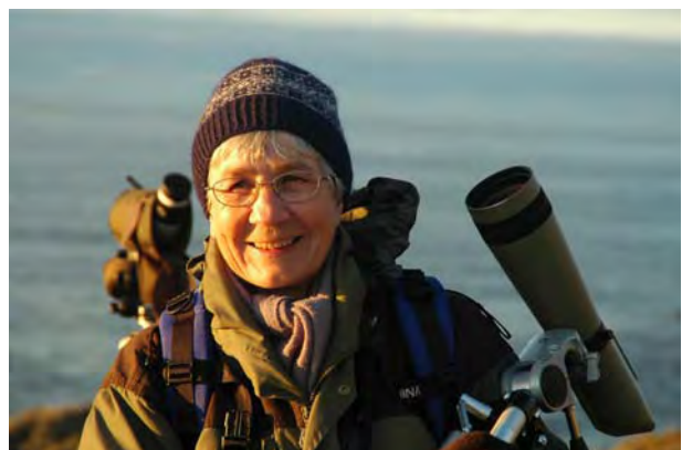
Turdeltager i midnattsol - © M. Günther.