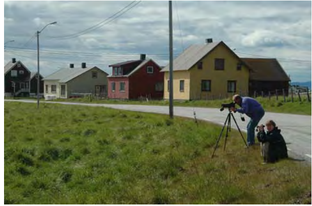
Vaderstudier ved Salttjern, Vadsø