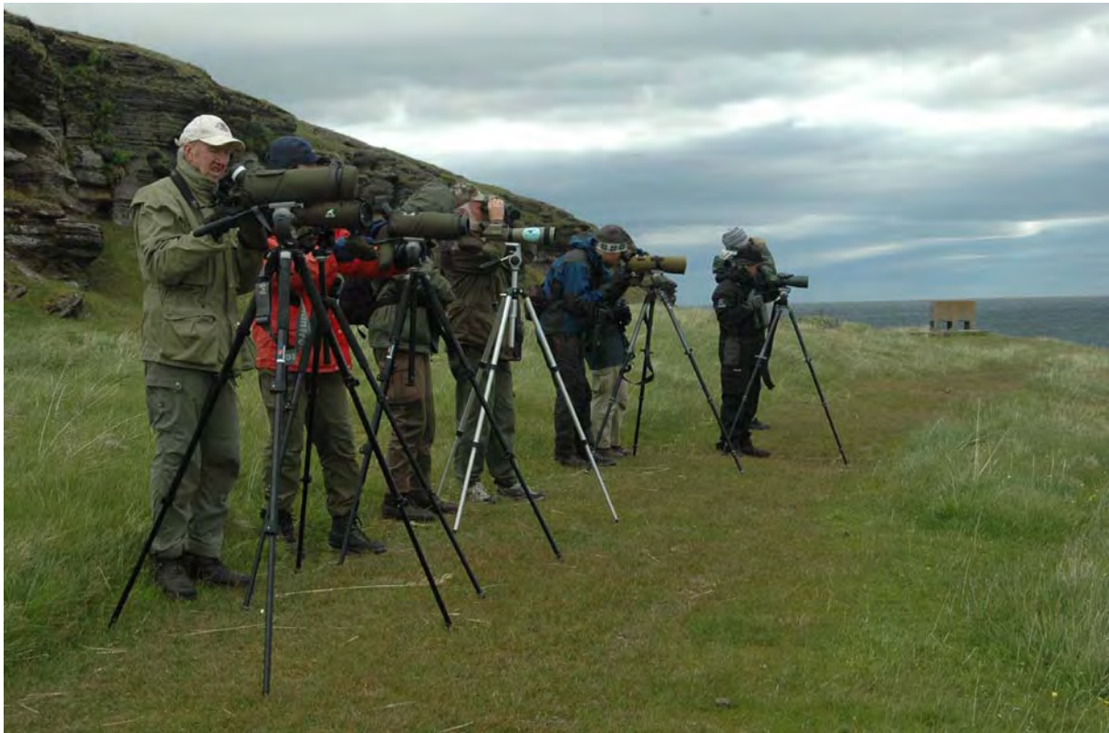
Leting etter lappiplerke på Store Ekkerøy, Vadsø - © M. Günther.

Etter en rolig natt i Vadsø fortsatte vi sakte østover med hyppige stopp bl.a. ved fuglefjellet på Ekkerøy, samt i Salttjern, Skallelv, Komagvær og Kiberg. Blant høydepunktene denne dagen var tusenvis av hekkende krykkjer, et par bergender, en polarmåke, flere fjelljo, diverse vadere, fjellerker, lappiplerker, bergirisk og lappspurv. En flokk på 23 stellerender rastet ved stranda i Kiberg. Vel fremme i Vardø fikk vi også med oss et par praktærfugler i tillegg til noen havsuler og diverse alkefugler.