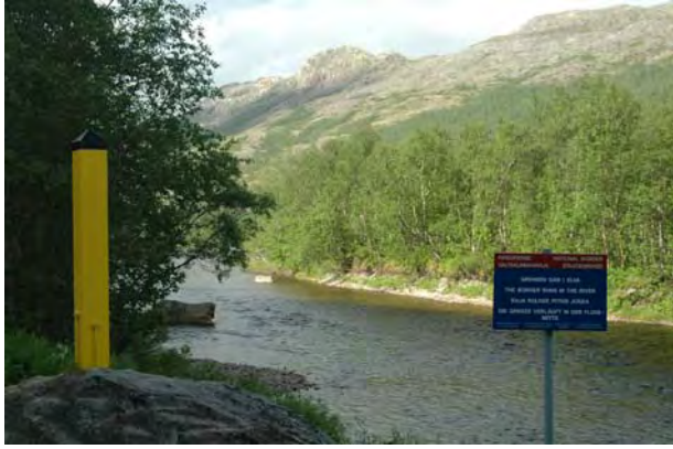
Norsk grensestolpe i Grense Jakobselv - © M. Günther.