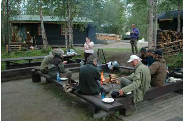
Middag på Melkefoss - © M. Günther.