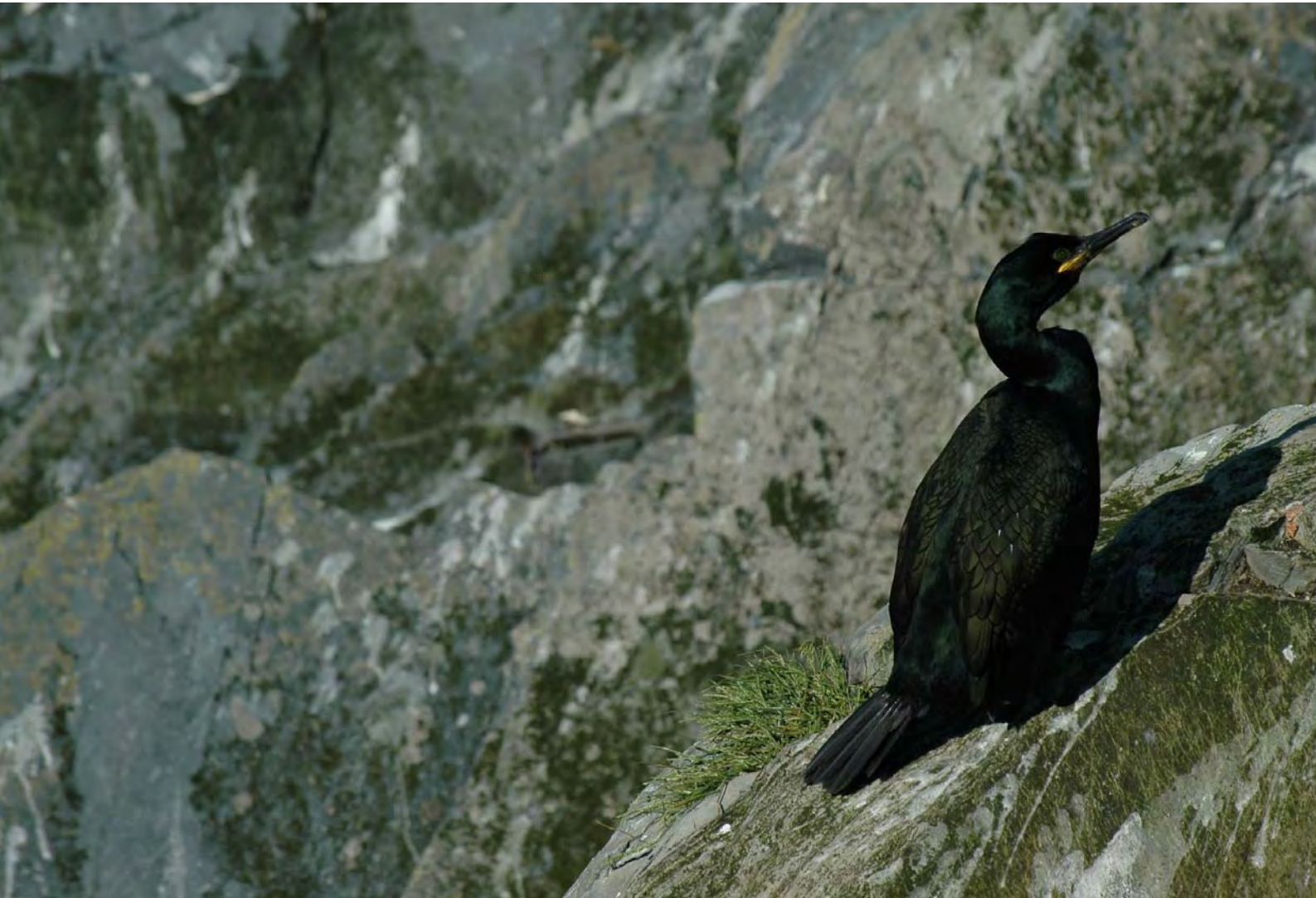
Toppskarv på Hornøya, Vardø - © Morten Günther.