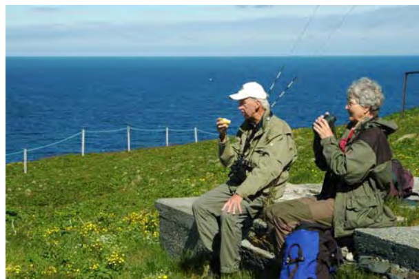
Lunch på toppen av Hornøya, Vardø