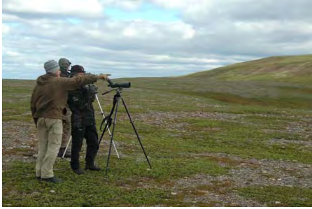
Forgjeves leting etter snøugle - © M. Günther.