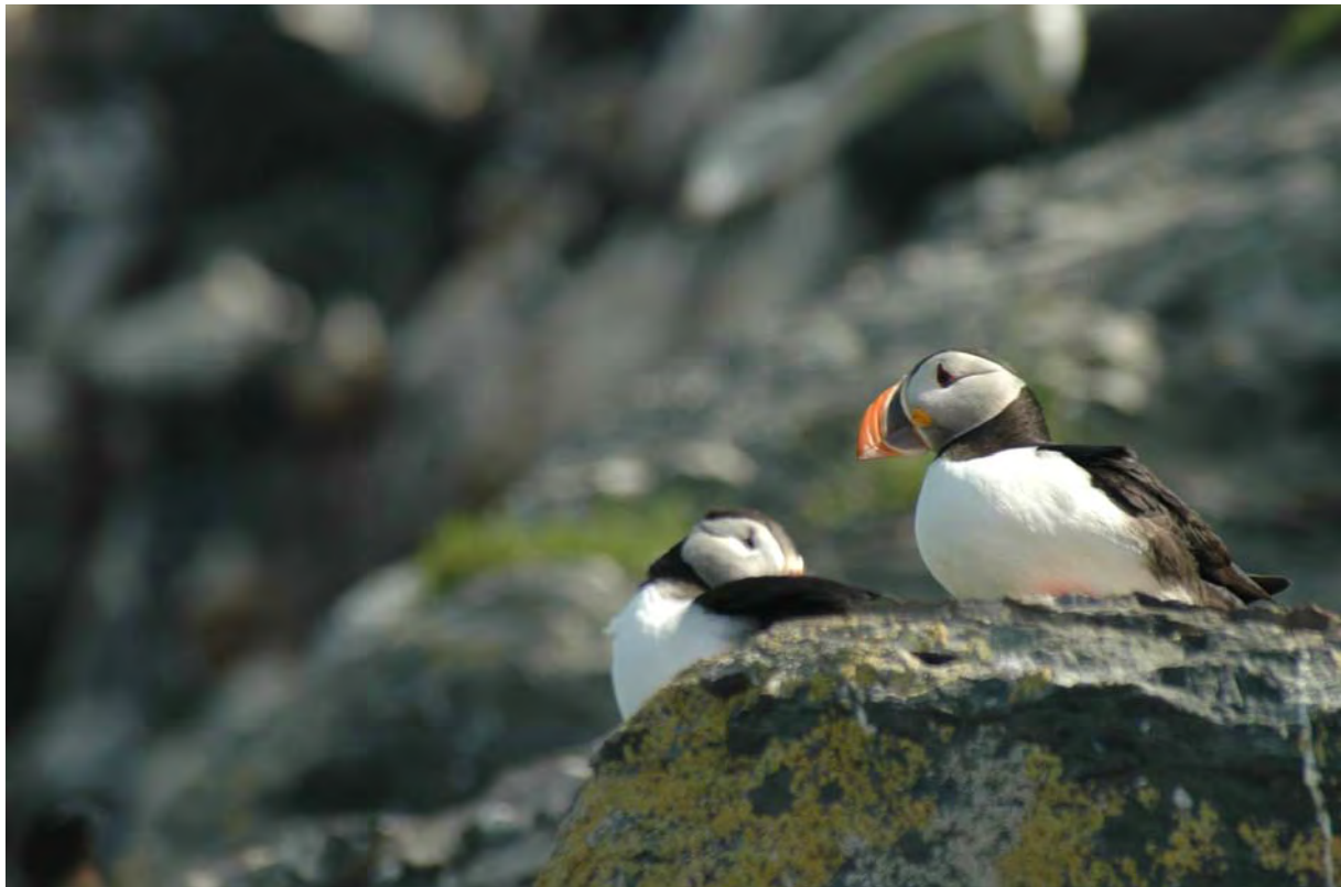
Lunde er en av karakterartene på Hornøya, Vardø - © M. Günther.