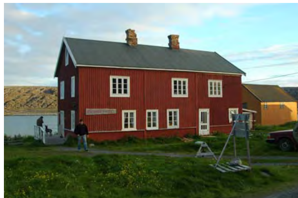
Parti fra Hamningberg, Båtsfjord - © M. Günther.