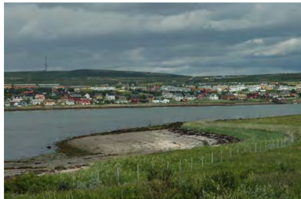
Vadsø sett fra Vadsøya - © M. Günther.