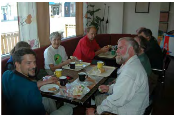
Gruppa samlet til lunch i Kirkenes