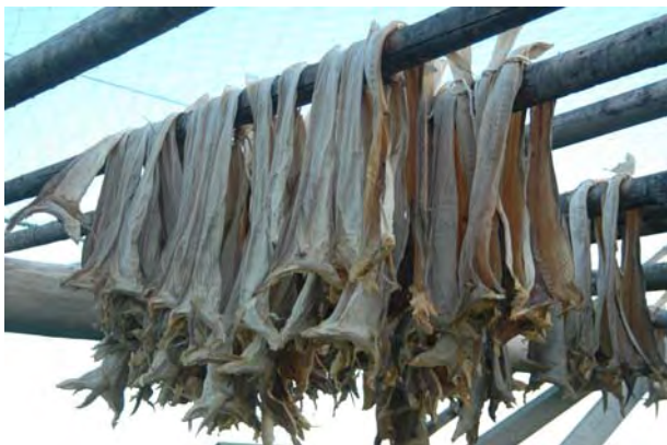
Fisk til tørk ved Smelror - © M. Günther.