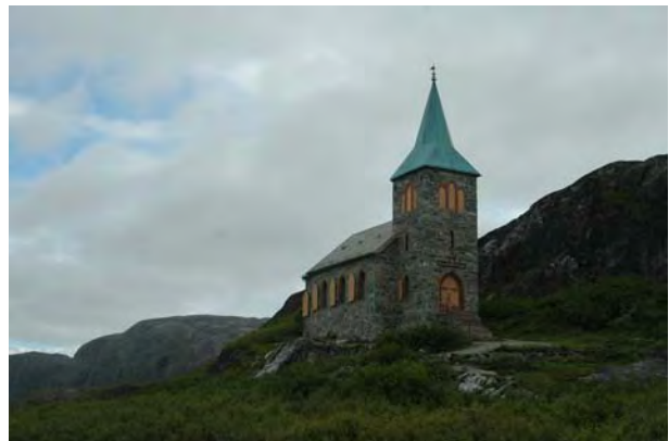
Kong Oscar II's kapell