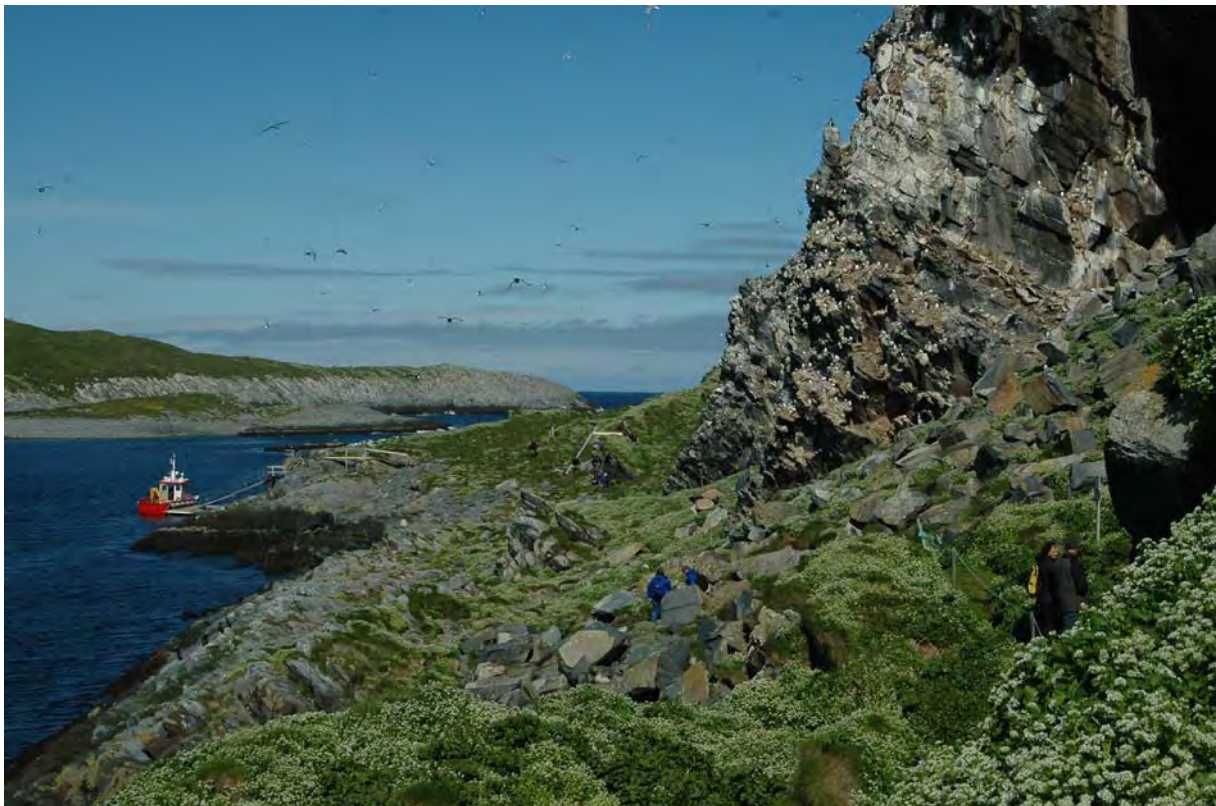
Hornøya, Vardø, er et av Norges flotteste og lettest tilgjengelige fuglefjell

Ny dag og nye muligheter. Vi fikk båtskyss ut til fuglefjellene på Hornøya der vi fikk nærkontakt med arter som toppskarv, lunde, lomvi, polarlomvi og alke. Resten av dagen brukte vi blant bratte klipper og vakre sandstrender langs nordkysten av Varangerhalvøya. Middag fikk vi servert i det fraflyttede fiskeværret Hamningberg. Underveis stoppet vi bl.a. ved Svartnes, Barvikmyran, Persfjorden og Sandfjorden. Mye sjøfugl å se langs kysten. Store flokker av ærfugl og laksand, men også mye krykkje, skarv og alkefugler. Flere havørn, lappspurv og noen snøspurv ble også observert før vi avsluttet dagen med et tjuetalls praktærflugl utenfor Smelror.