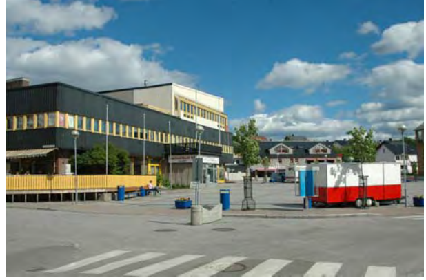
Strålende vær på torget i Kirkenes - © M. Günther.