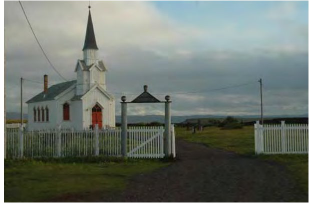
Nesseby kirke, Nesseby