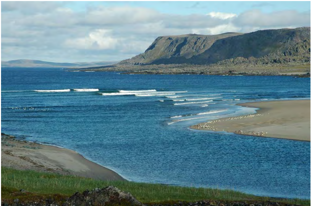
Arktisk kystlandskap i Sandfjorden, Båtsfjord - © M. Günther.