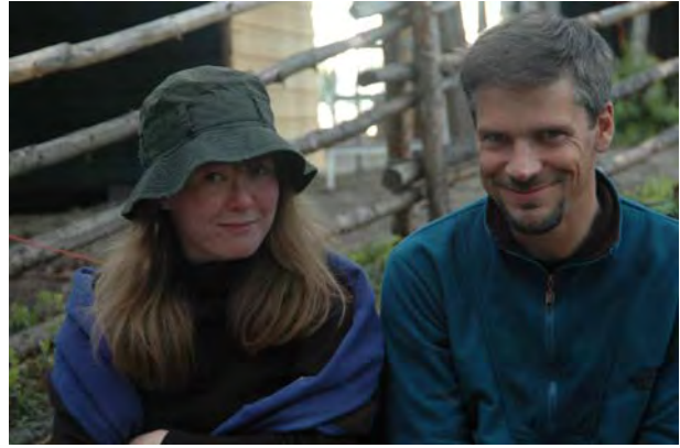
Fornøyde turdeltagere