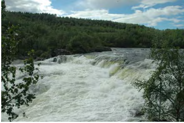
Skoltefossen i Neiden, Sør-Varanger - © M. Günther.