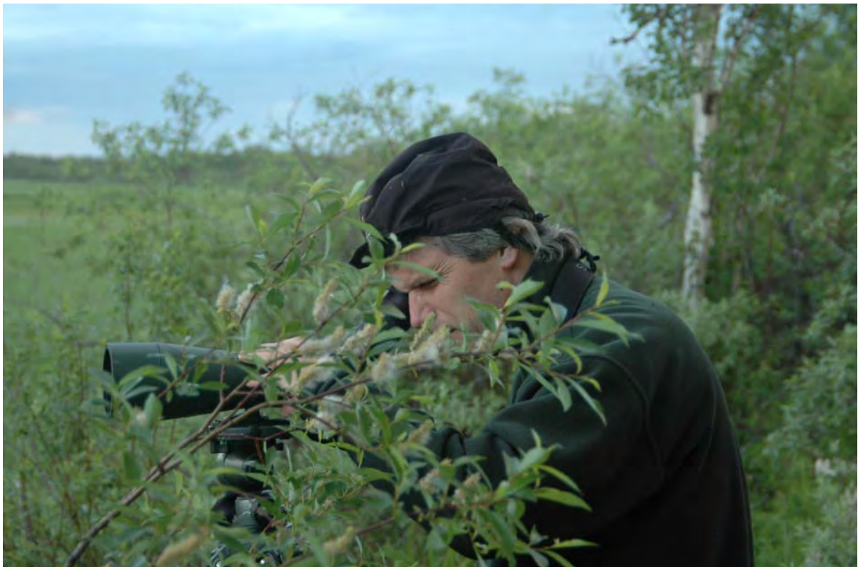
Studie av vadefugler ved fugletårnet på innsiden av Lille Skogøy, Sør-Varanger - © M. Günther.