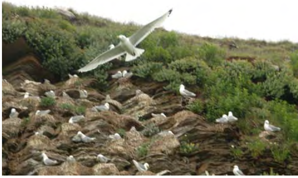
Krykkjekoloni ved Ekkerøy