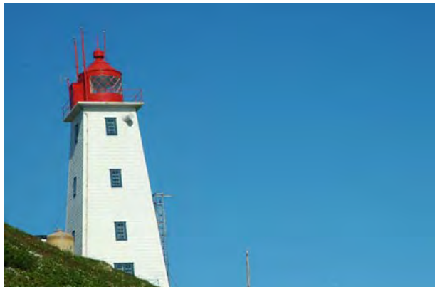
Fyret på Hornøya, Vardø - © M. Günther.

Etter nok en natt i landets østligste by satte vi kursen tilbake mot Kirkenes. Underveis talte vi 131 svømmesnipper i dammen på Vadsøya. Nevnes bør også to syngende hagesangere ved Neiden kirke.