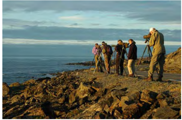
Sjøfuglstudier ved Finnvik, Båtsfjord - © M. Günther.