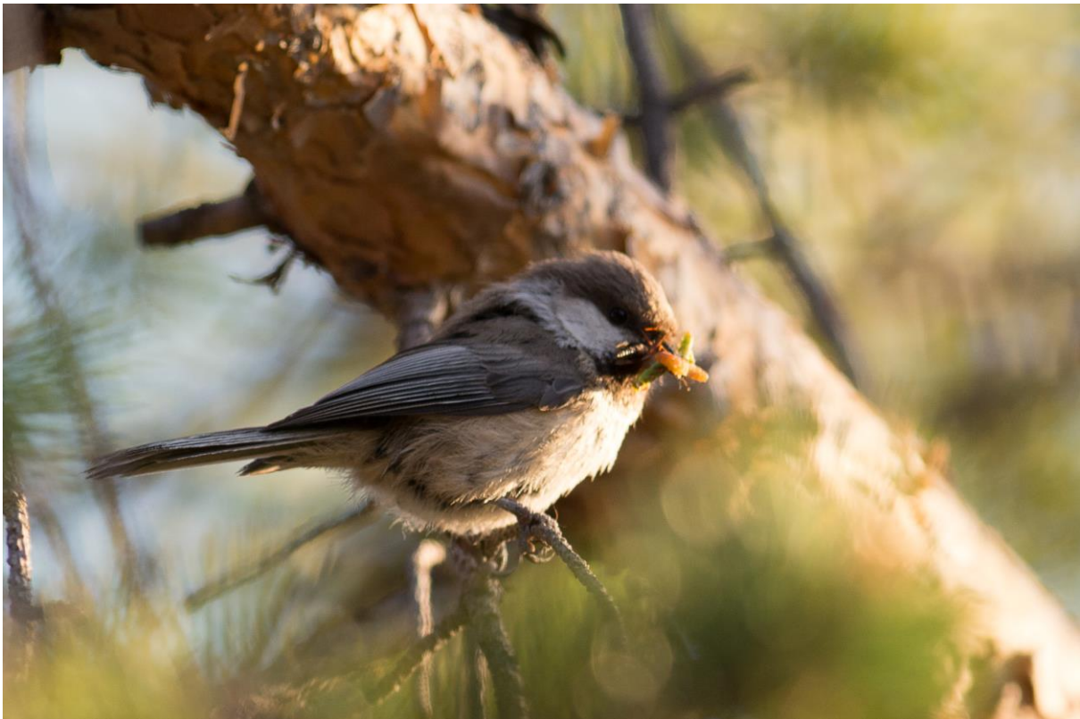
Lappmeis med mat til unger