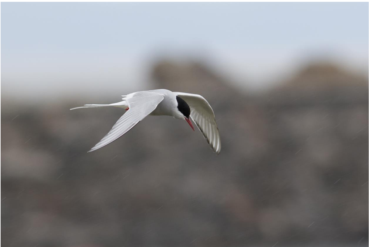
Rødnebbterne i regn