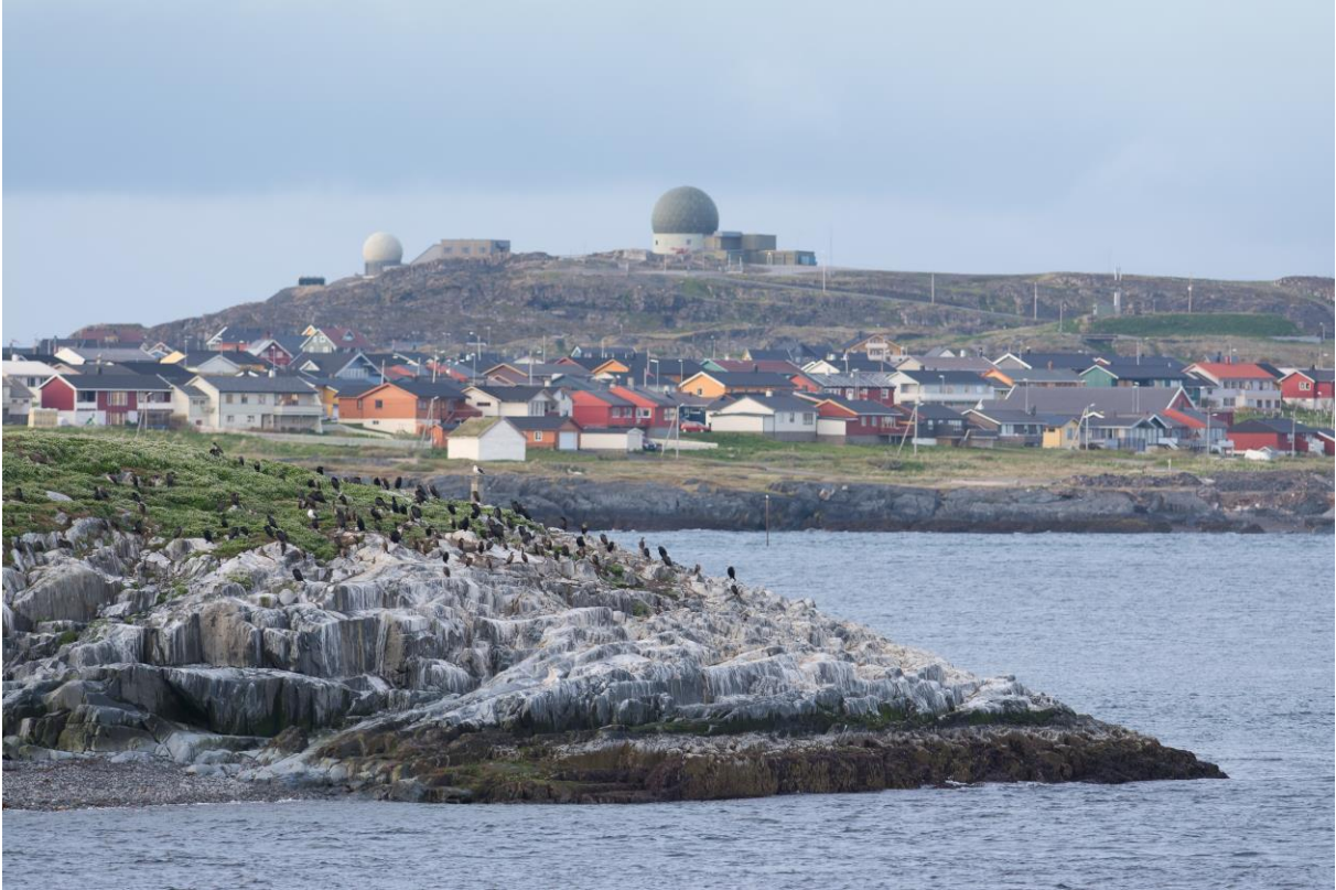
Vardø sett fra Smelror