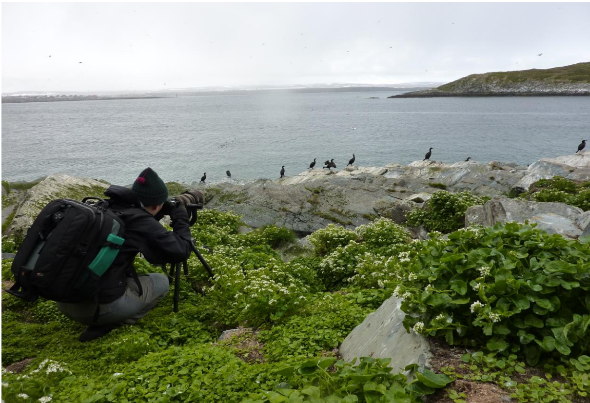
Rine fotografierer toppskarv på Hornøya - © Silje Toril Grønås Johnson.

Turens første polarlomvi dukket opp allerede før vi hadde forlatt havna. Senere skulle det bli flere. Været viste seg fra sin beste side, selv om fotografene kanskje kunnet ønsket seg et noe mykere lys. Vel i land på øya hadde vi drøyt to timer til rådighet. Noen slo seg ned i fugleskjulet mens andre valgte å spasere opp til fyret for å se det hele ovenfra. Hundrevis av toppskarv, krykkje, alke, lomvi og lunde lot seg villig fotografere på kort hold. Noen polarlomvi var også ganske samarbeidsvillige, mens gråsisik og bergirisk kun fløy rastløst forbi. Både heipiplerke og lappiplerke ble observert, i tillegg til et par fine skjærpiplerker.