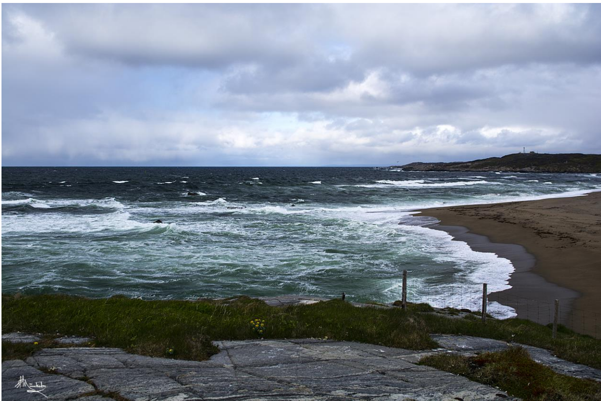
Utsikt østover fra Grense Jakobselv

Etter en deilig tre retters middag på Gapahuken restaurant og påfølgende logg, tok de ivrigste deltagerne en sen kveldstur tilbake til Jarfjordbotn for å lytte etter lappsanger. Heller ikke denne gang ble det suksess. Turens første syngende sivsanger og en hagesanger ved Storslåtten ble imidlertid et lite plaster på såret før vi vendte tilbake til Sollia for å sove.