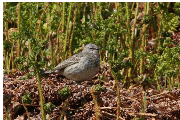
Toppskarv og skjærpiplerke på Hornøya