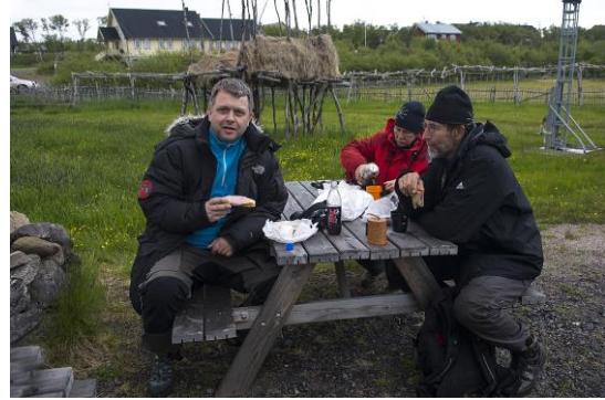
Lunsj i Varangerbotn - © Hanne Holte Munkeby.