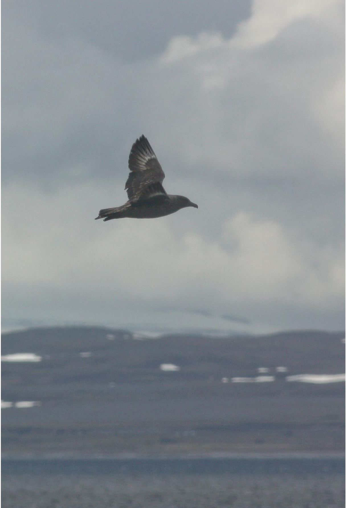
Storjo i Varangerfjorden - © Bjarne B. L. Andersen.