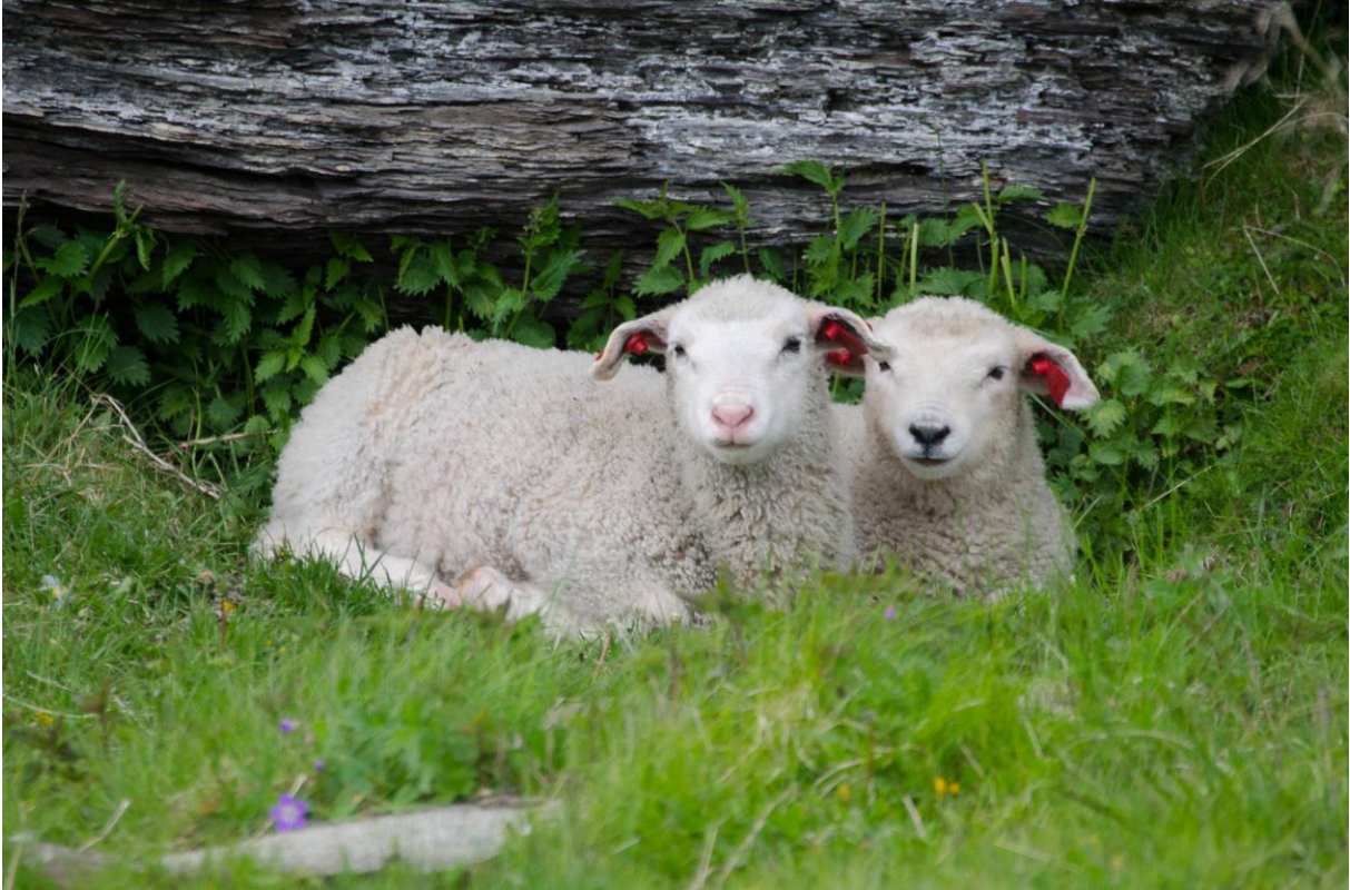
Lam på Store Ekkerøy, Vadsø - © Morten Günther.