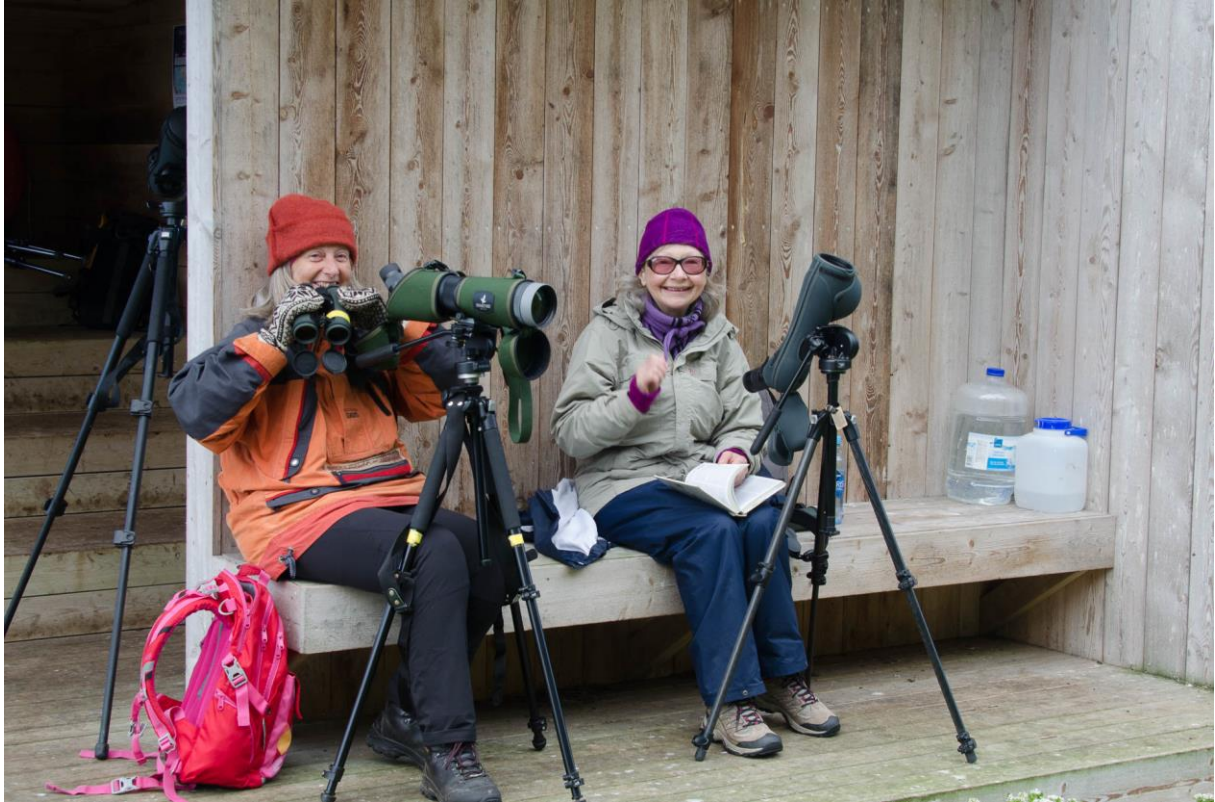
Glade turdeltagere på Hornøya.