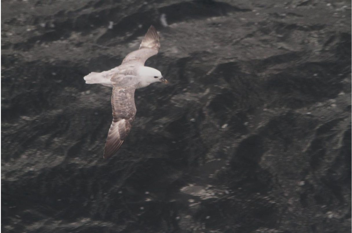
Havhest - © Gunstein Wigemyr.