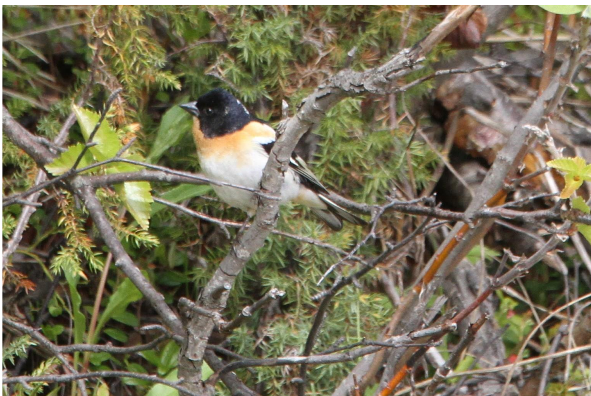
Bjørkefink - © Gunstein Wigemyr.