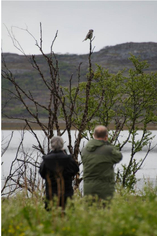
Fotogen haukugle ved Nyborg - © Morten Günther.