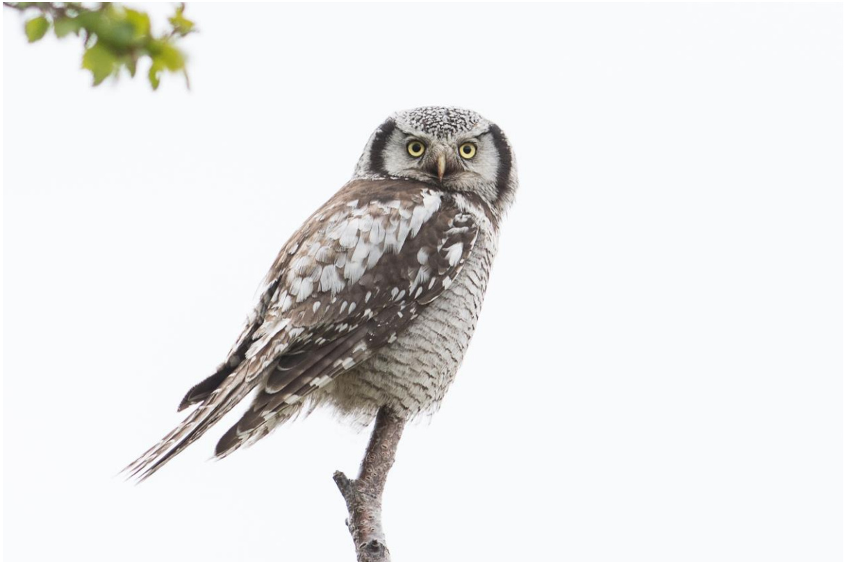
Haukugle ved Nyborg