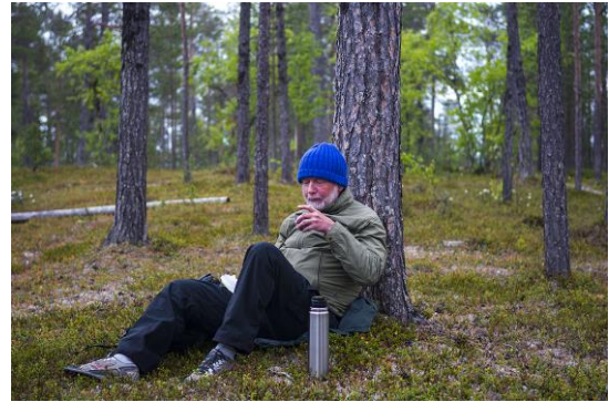
Lunsj i skogen ovenfor Noatun

I stedet fortsatte vi sørover til politistasjonen ved Nyrud. Her hadde vi bl.a. smålom og lavskrike. Strekingen mellom Nyrud og Hestefosdammen ga en lirype og en tårnfalk, men ellers ikke noe spesielt. Heller ikke her fant vi dvergspurv, selv om reiseleder hadde hatt to stykker syngende for kun få dager siden. I nordenden av Hestefosdammen hadde vi en stjertand med unger, storlom, småspove, dvergmåke, sidensvans og gulerle (såerle). En måltrost sang ved Blankvassåsen.