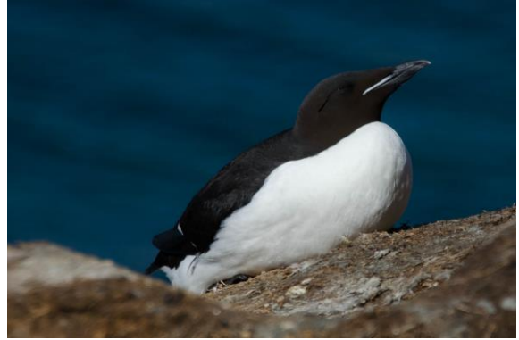
Deltagerne fotograferer toppskarv og polarlomvi på Hornøya - © Morten Günther.