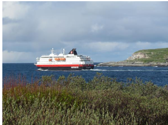
Sjøfuglskåning fra hurtigruteskipet MS Kong Harald