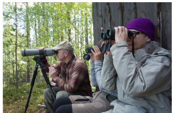
Stemmingsbilder fra Pasvikdalen - © Rine G. Carlsen.