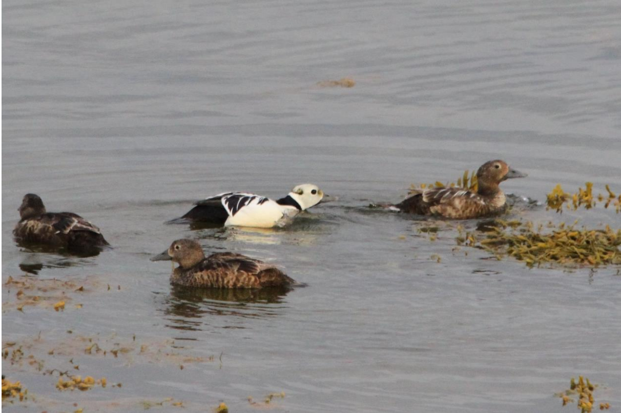
Stellerender i Vadsø havn, Vadsø - © Gunstein Wigemyr.