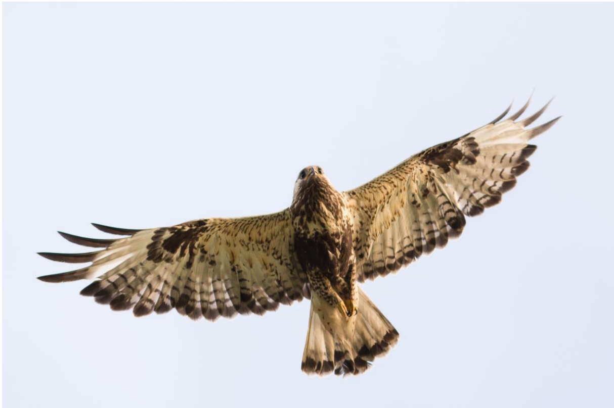
Fjellvåk ved Skrøytnesmyra - © Rine G. Carlsen.

Litt før kl.01:00 var vi tilbake på Svanhøvd og de fleste av deltagerne var mer enn klare for å gå til ro. Et par av de aller ivrigste overtalte imidlertid reiselederen til å bli med på nok en tur tilbake til Skrøytnes for å fotografere. Været var fantastisk og midnattsola satte farge på tilværelsen. To elg beitet i veikanten mellom Svanvik og Loken. Vi fikk også med oss to sædgås, en heilo og et par liryper på Skrøytnesmyra. Ved Kløvereng kom vi over to ivrig varslende fjellvåk som tydeligvis hadde reir like i nærheten. Telensene gikk som maskingevær i noen minutter.