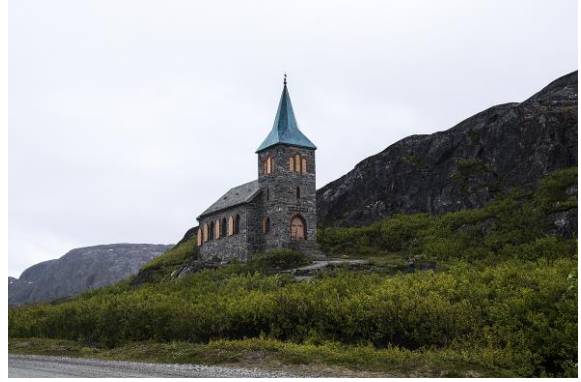
Kong Oscar IIs kapell - © Hanne Holte Munkeby.