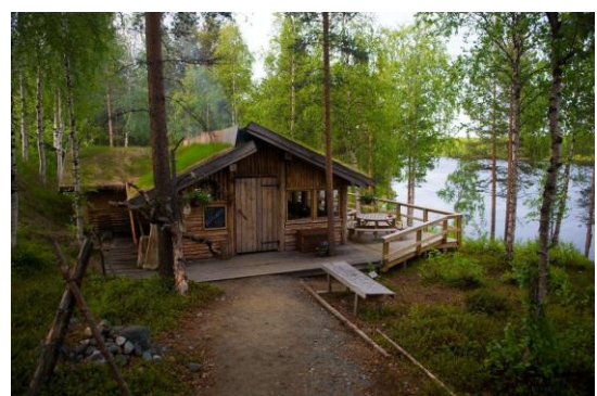
Middag hos BIRK Husky på Melkefoss - © Hanne Holte Munkeby.

Etter middag kjørte vi nordover langs elva bort til fugletårnet ved Lille Skogøy. Litt utfordrende å få plass til 12 personer i det lille tårnet, men det gikk sånn noenlunde. Dog var det ikke plass til alle teleskopene. Dermed måtte vi titte på omgang. De fleste fuglene lå dessverre ganske langt unna, men vi klarte likevel å identifisere et par sangsvaner, en stokkand, 42 brunnakker, to skjeender, to krikkender, en kvinand og 45 toppender. Av vadere ble småspove, gluttsnipe og grønnefink registrert.