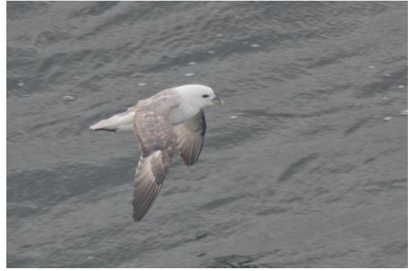
Fjelljo og havhest fotografert fra Hurtigruta - © Bjarne B. L. Andersen.