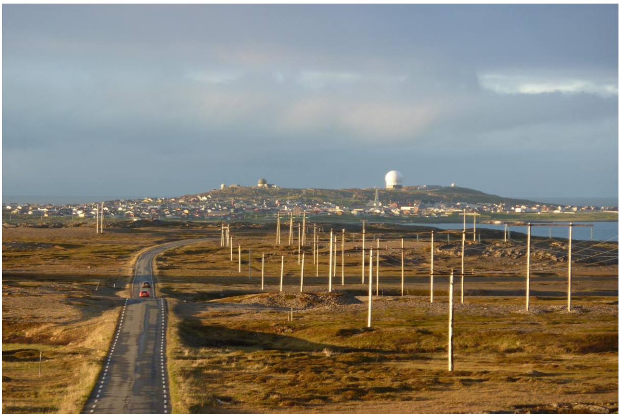
På vei tilbake til Vardø - © Silje Toril Grønås Johnson.