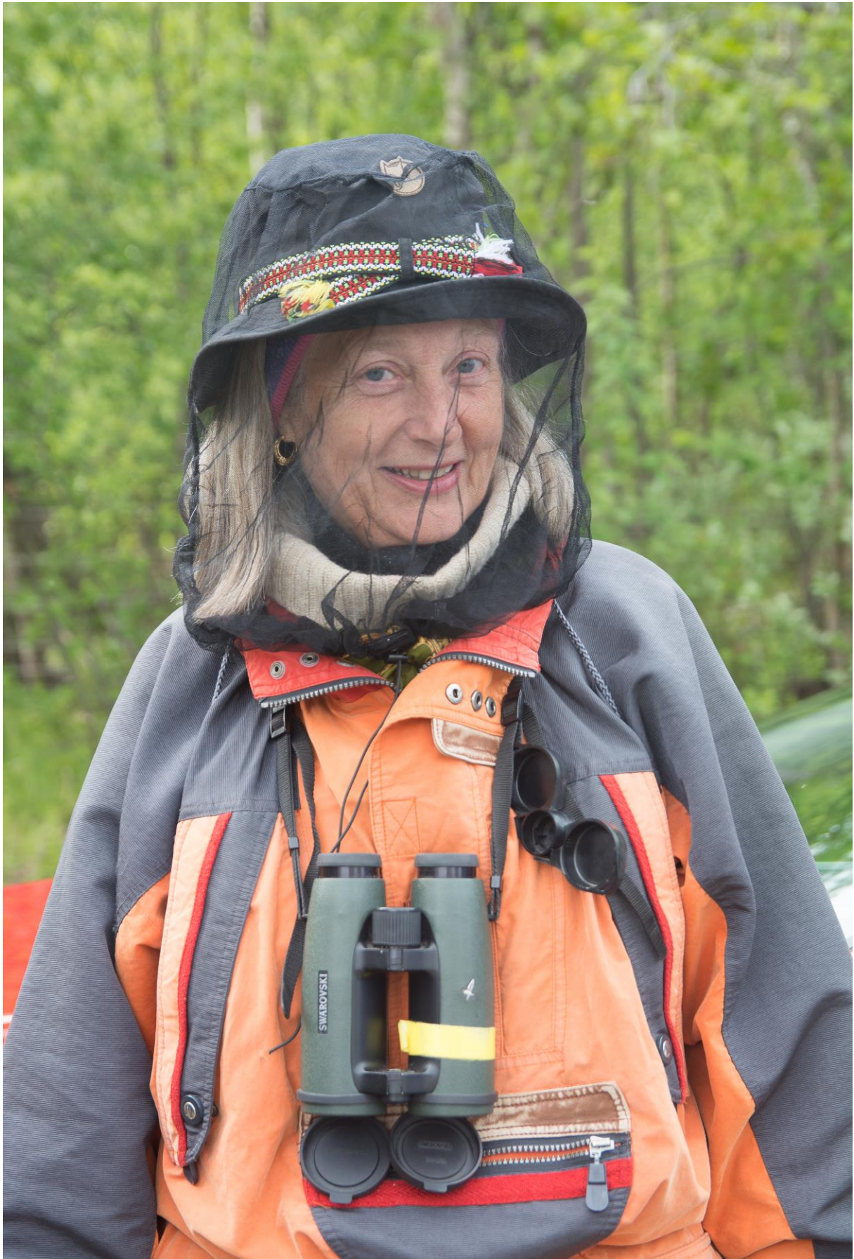
Ut på tur aldri sur