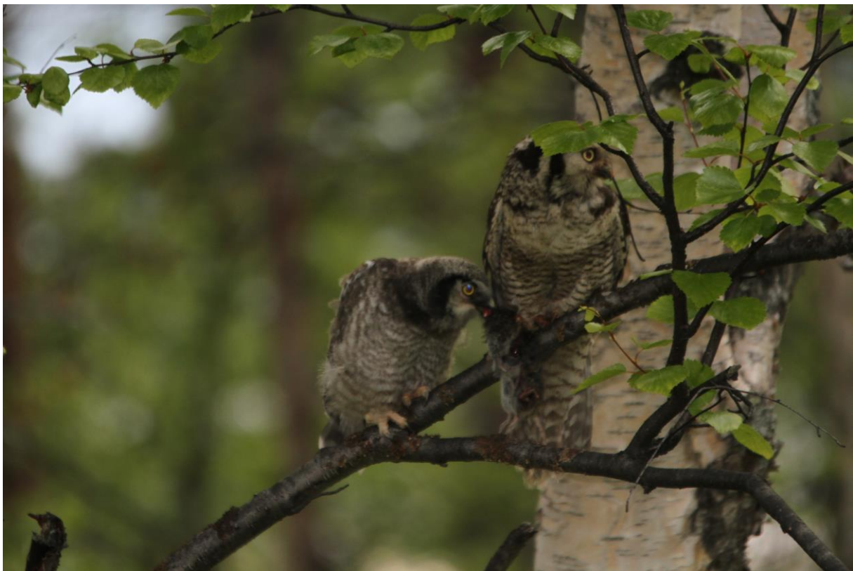
Haukugle mater unge ved Myrset i Pasvikdalen - © Gunstein Wigemyr.