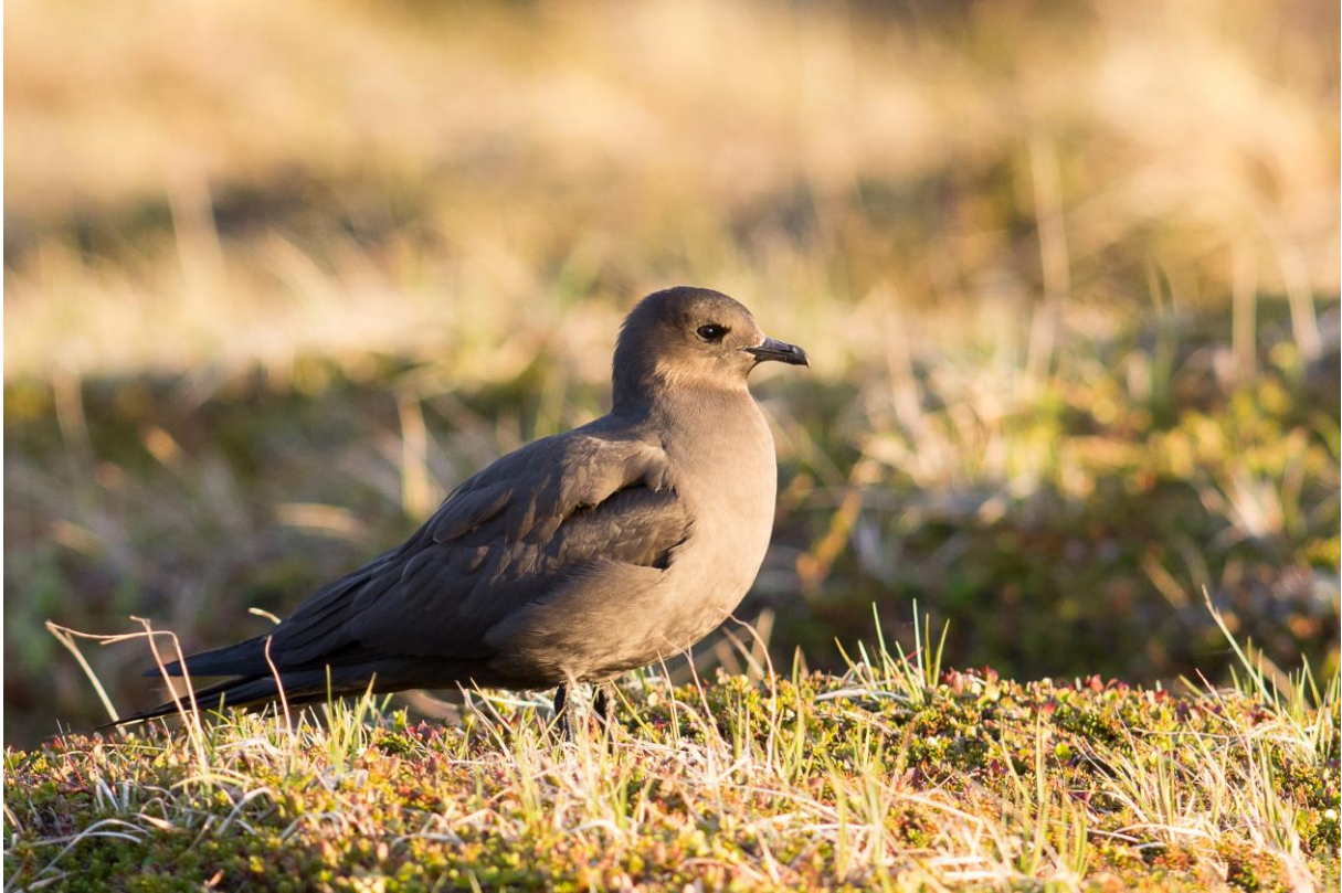
Tyvjo - © Rine G. Carlsen.