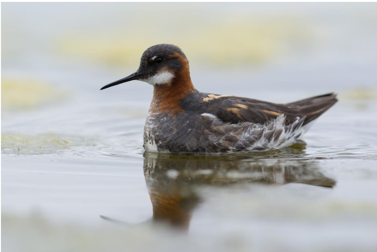
Svømmesnipen ved Nesseby kirke - © Rine G. Carlsen.