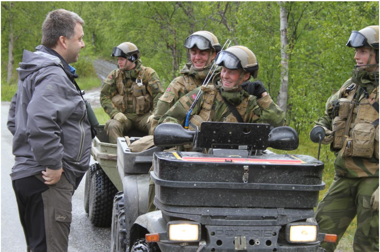
Reiselederen i samtale med norske grensevakter - © Gunstein Wigemyr.