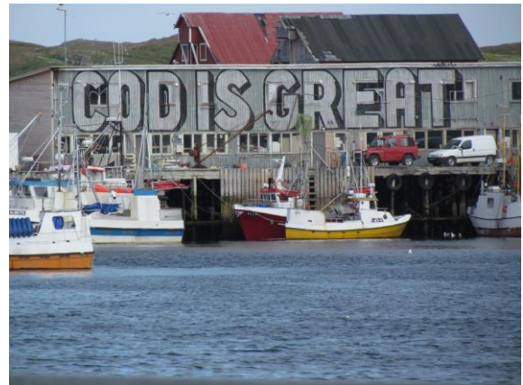
Parti fra Vardø havn