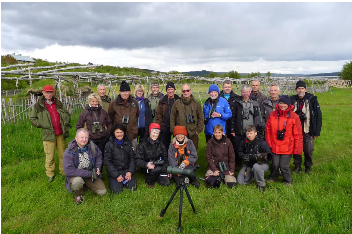
Begge turgruppene samlet i Varangerbotn - © Hanne Holte Munkeby.

1 ind. observert ved Noatun, Sør-Varanger 28.06.2014 kl.13:00 til kl.15:30