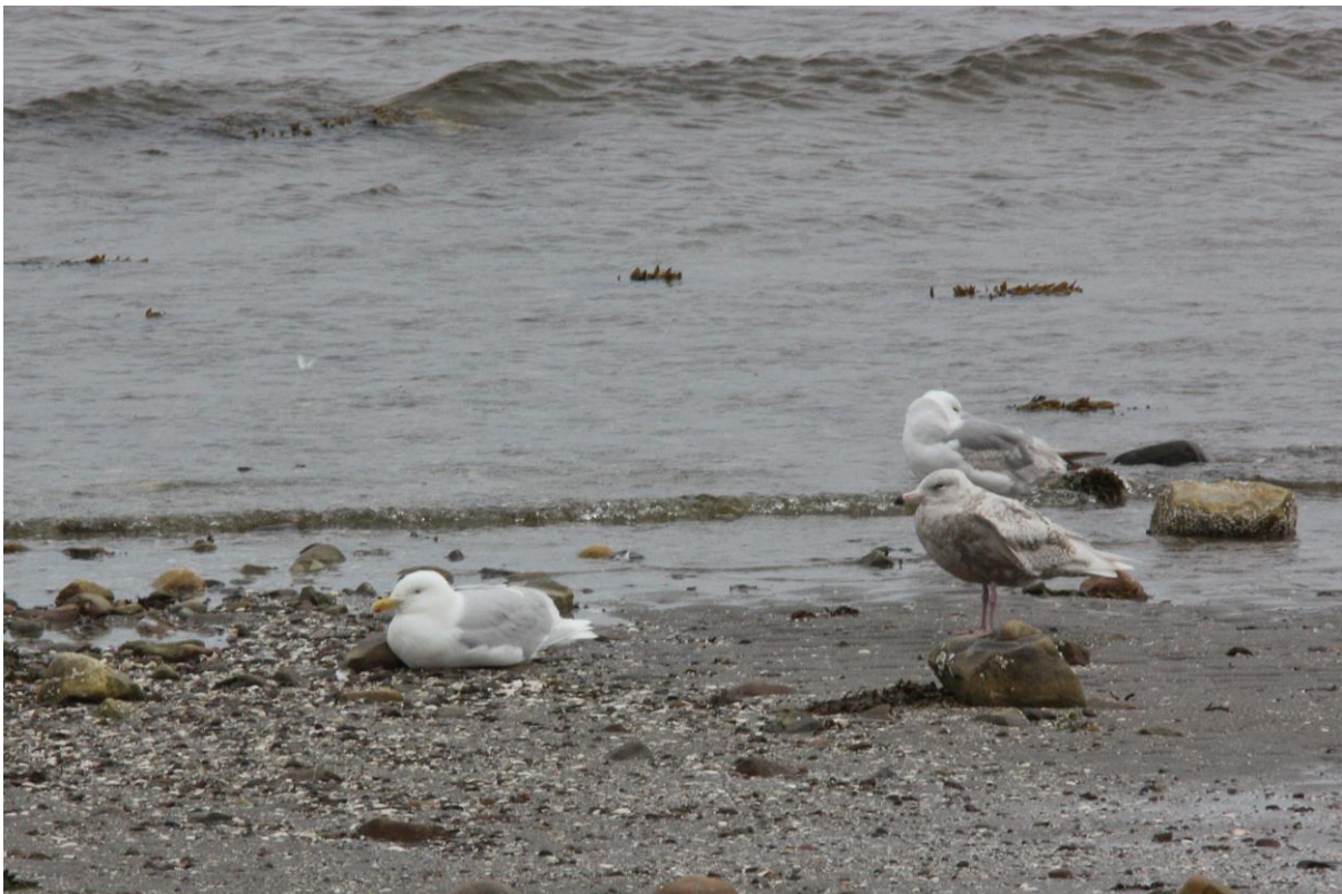
Polarmåke - © Bjarne B. L. Andersen.