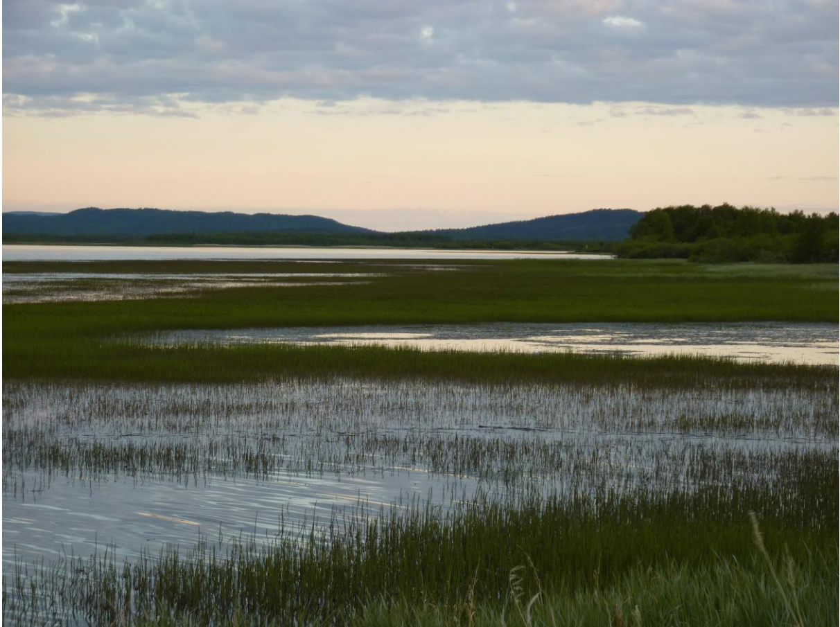
Pasvikelva ved Lille Skogøy - © Silje Toril Grønås Johnson.