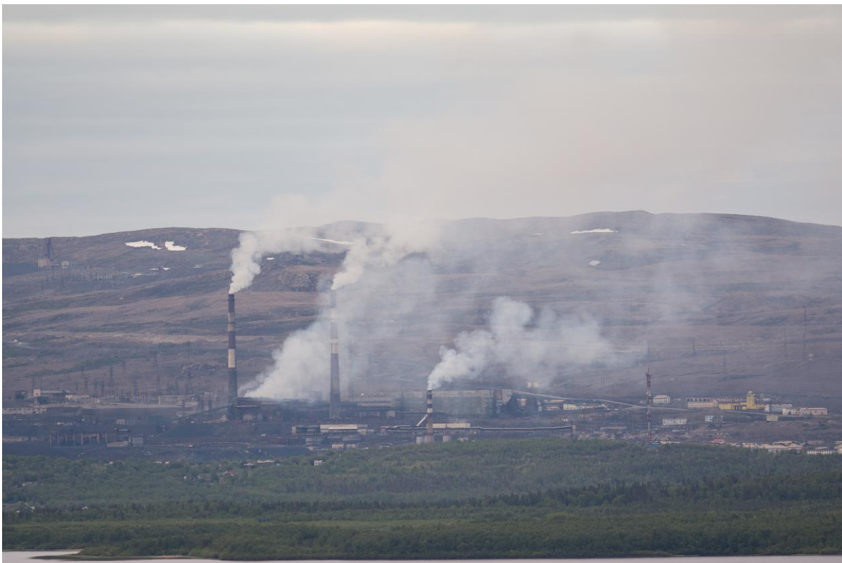
Gruvebyen Nikel sett fra Nittisekshøgda - © Rine G. Carlsen.

Takk til hver og en som bidro til en hyggelig tur! En ekstra takk til sjåførene for sikker kjøring og positiv innstilling!