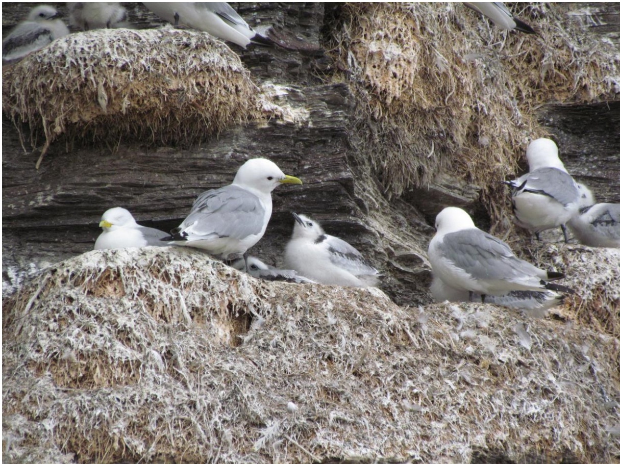
Krykkjer med unger på Store Ekkerøy, Vadsø - © Arvid Jebens.

Etter hvert begynte vi å bli sultne selv og det var derfor deilig å kunne innta en bedre middag på Rica Hotel Vadsø der vi også skulle tilbringe natten. Før vi gikk til ro tok vi en liten tur ned i havna for å studere fire oversomrende stellerender (inkludert en hann i praktdrakt) som hadde hatt tilhold der en stund. De siste årene har det vært vanskelig å finne stellerender i varangerfjorden om sommeren så dette var en kjærkommen overraskelse. En rask spasertur rundt den østlige delen av Vadsøya ga turens første buskskvett, fem svømmesniper og diverse vadere. En flokk med 32 lappspover rastet i Ytrebyfjæra.