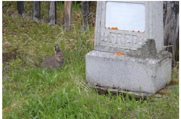
Sjøfuglskåding og hareunge ved Grense Jakobselv - © Gunstein Wigemyr.