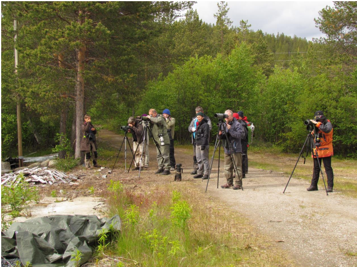
Deltagerne studerer dvergmåker ved Noatun - © Bjarne B. L. Andersen.

Sør for Vaggatem lette vi forgjeves etter dvergspurv både ved Kveldro og Grautbekken. Begge steder var det helt stille.