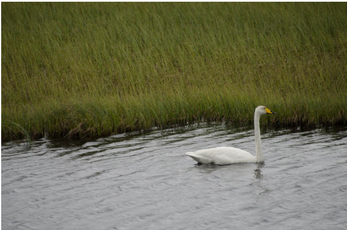
Sangsvane på Varangerhalvøya - © Morten Günther.

Tilbake i Vardø spiste vi matpakkelunsj på hotellet. En kjapp logg tok vi oss også tid til før vi kjørte bort til heksemonumentet på Steilneset. Her hadde vi turens eneste sanglerke.