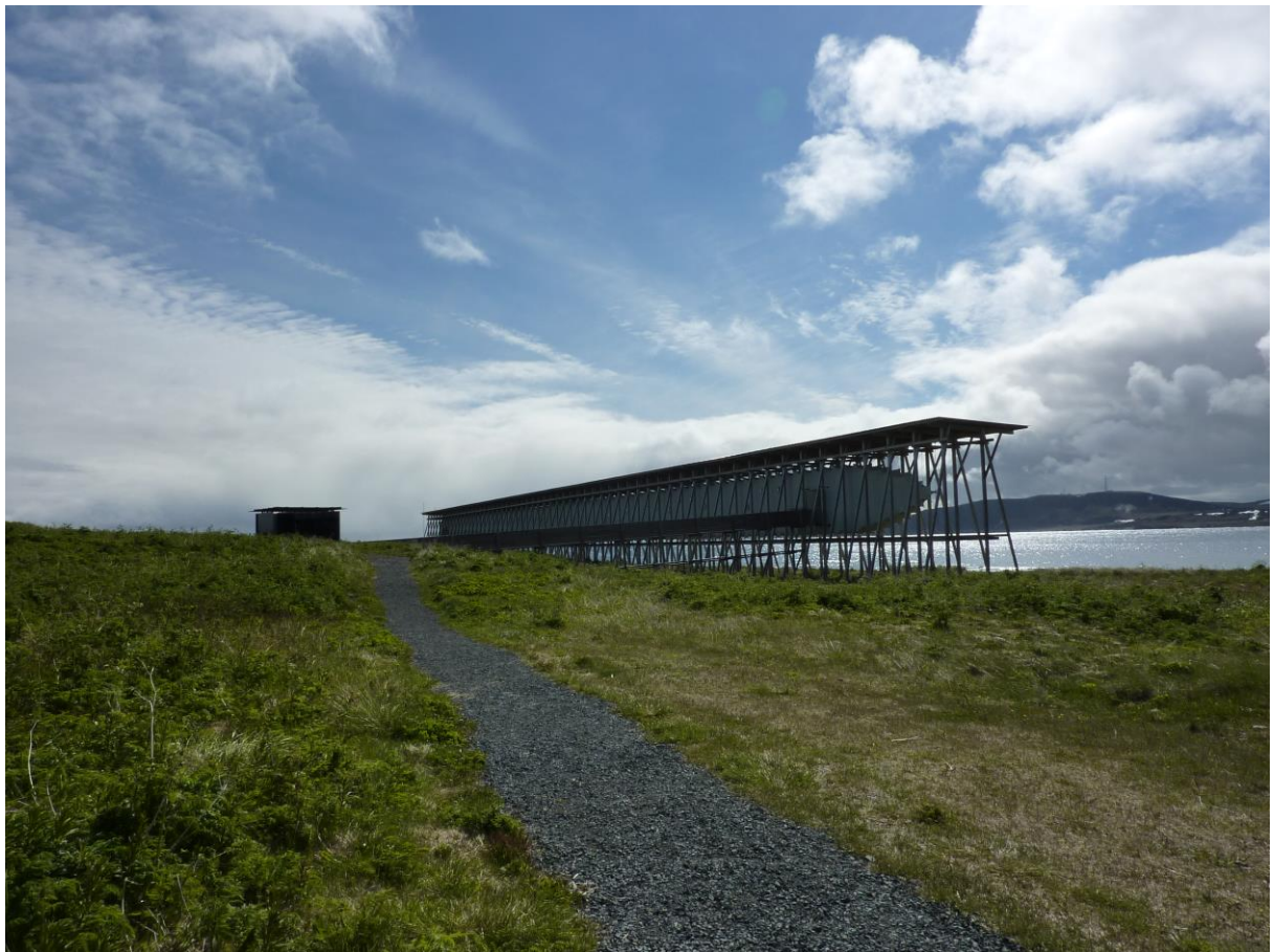
Heksemonumentet på Steilneset - © Silje Toril Grønås Johnson.