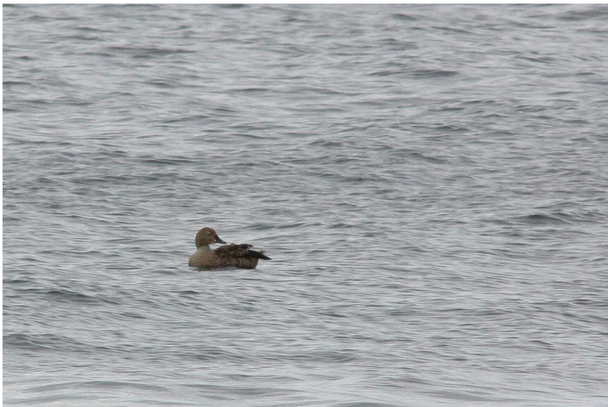
Praktærfugl - © Bjarne B. L. Andersen.