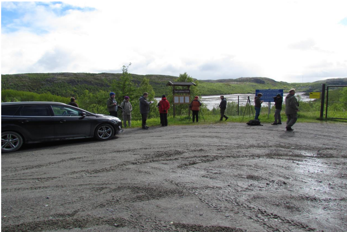
Deltagerne samlet ved Skafferhullet - © Arvid Jebens.

Hillerød (DK) Hillerød (DK) Oslo Oslo Oslo