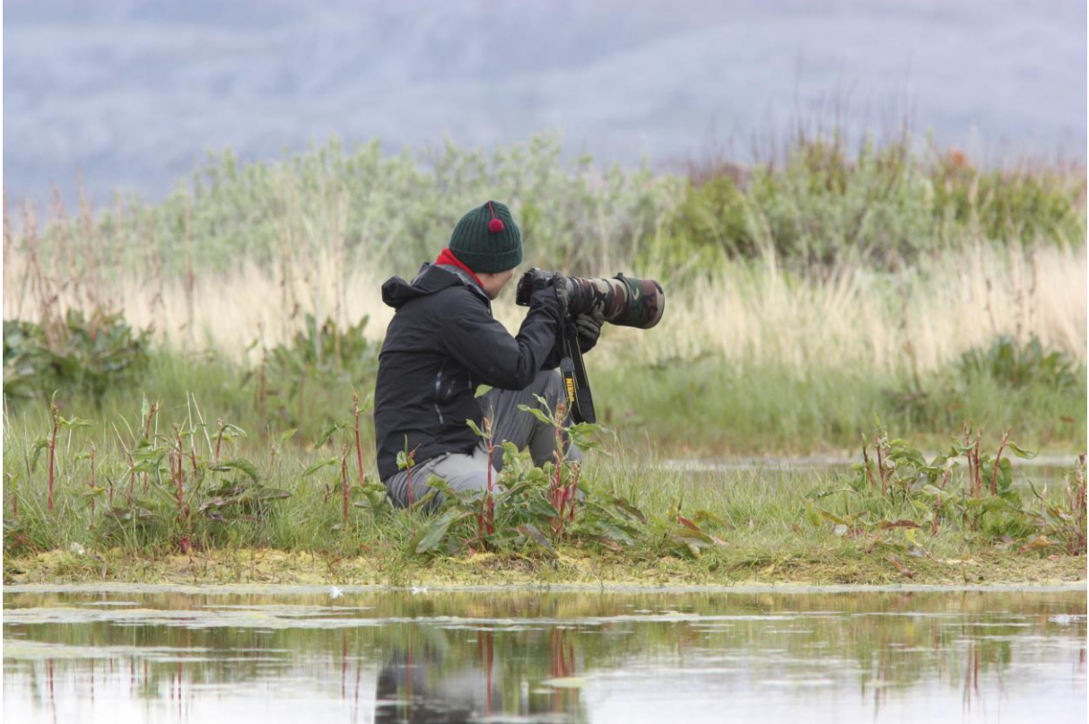
Rine G. Carlsen fotograferer svømmesnipen ved Nesseby kirke - © Bjarne B. L. Andersen.