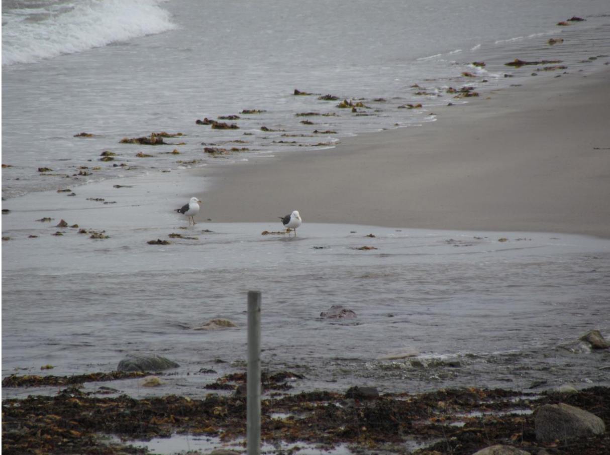
Sildemåke (Larus fuscus).

2 ad. Kramvik, Vardø fra 26.06.2014 16:15 til 26.06.2014 16:30.