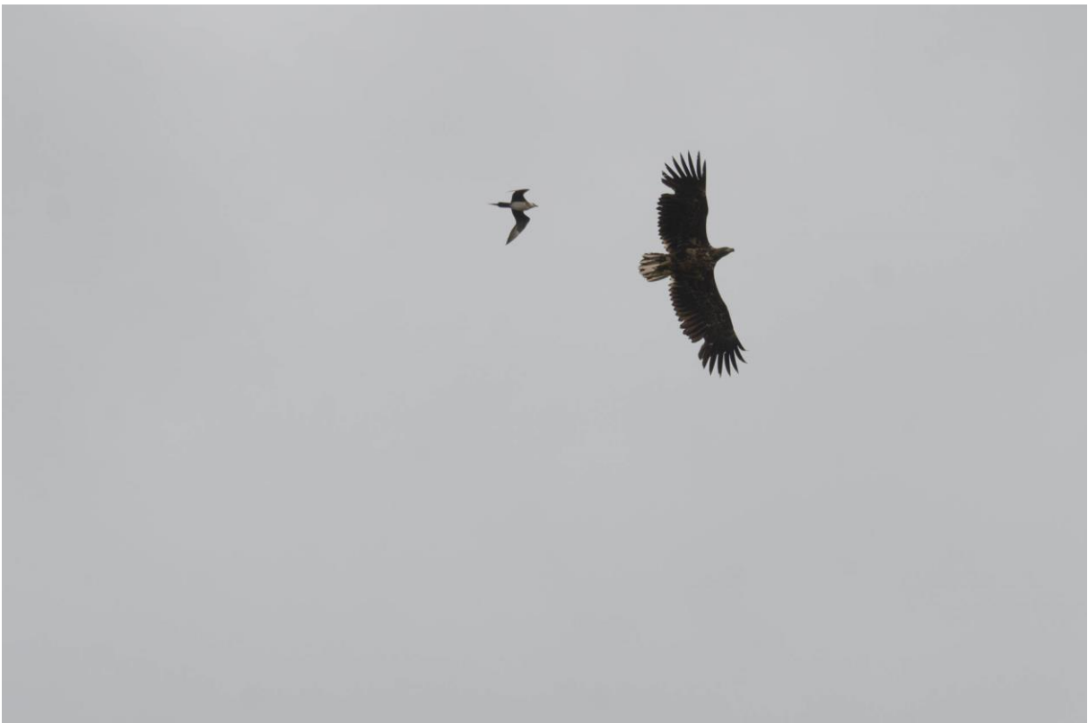
Tyvjo mobber en havørn - © Morten Günther.