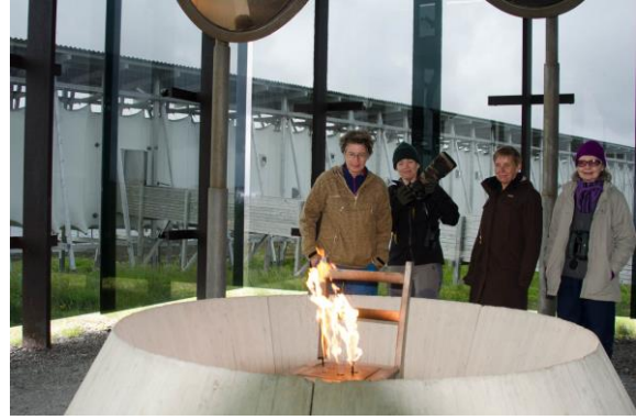
Heksemonumentet på Steilneset - © Morten Günther.