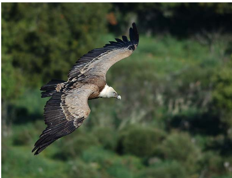
Gåsegribb Extremadura.