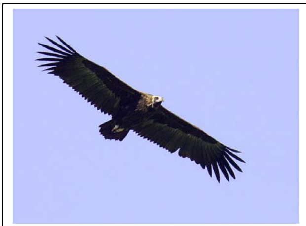
Munkegribb. Ved Trujillo.

Etter innkjøp av frokost/lunsj, bar det ut på veien nordover. Vi stoppet ganske raskt på en kjerrevei. Her ble det et deilig måltid i det fri med brød, ost, oliven, skinke, yoghurt osv. Men noe særlig matro ble det ikke. Med det fine været begynte også rovfuglene å røre på seg. Det var gåsegribb, munkegribb og åtselgribb på vingene. Både svart- og "rød" glente også. En og annen slangeørn og plutselig også en haukørn. For ikke å glemme dvergørner i begge varianter. Fra den nærliggende eukalyptusklyngen kom det stadige småflokker med middelhavsspurv. Jo, vi var godt i gang!