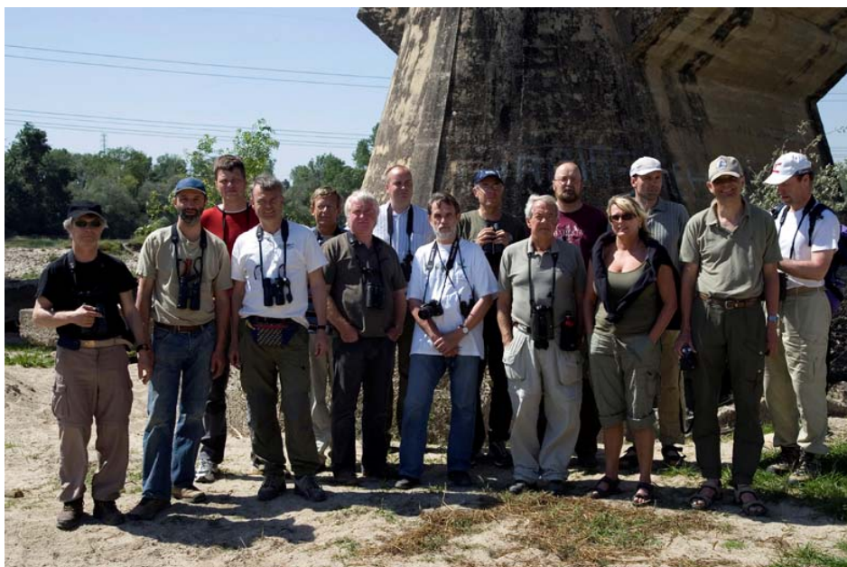
Deltagere på NOF Travels tur til Extremadura.