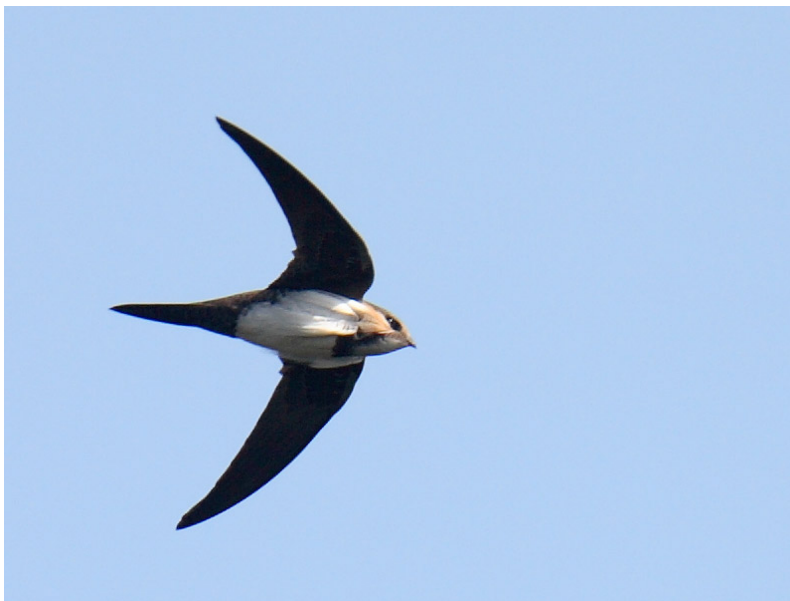
Alpeseiler. Extremadura.

1 ind. sett av observante turdeltagere ved Embalse de Arroyocampo ved Almaraz.