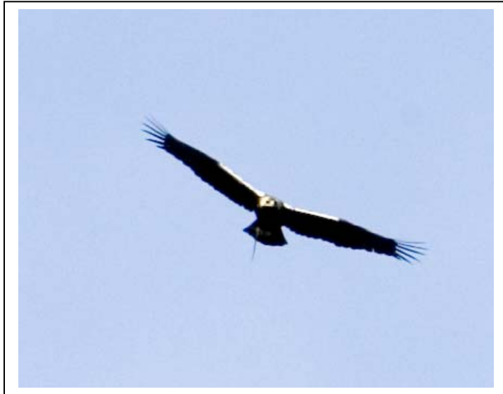
Iberiaørn, Monfragüe.

Denne rapporten omhandler NOF Travels tur til Extremadura i april 2007. Til sammen deltok 16 personer fra mange deler av landet. Turen ble en suksess både fuglemessig og sosialt. Totalt fikk vi 131 arter. Vi så de aller fleste av spesialitetene området kan by på, herunder den meget, sjeldne iberiaørnen.