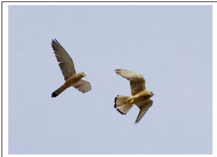
Rødfalker, Trujillo, Extremadura.

En av sjåførene var litt uheldig med et veivalg, og kjørte seg fast. Bilen kom seg greit på veien igjen, men vi kunne ikke la være å legge merke til vannlekkasjen. Nå fikk turleder bange anelser...Heldigvis hadde Trujillo et utmerket Peugeot-verksted. Her konstaterte de at det dreide seg om helt vanlig drypp fra bilens klimaanlegg. Nå skinte solen igjen!