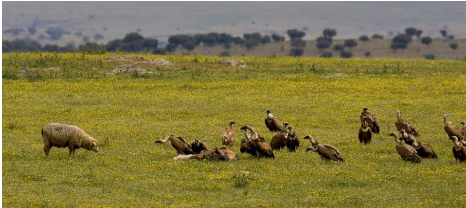
Gåsegribber på lam.

Marta stoppet vi og beskuet en gribbeflokk som satt og ventet på at et ganske nyfødt lam skulle forlate denne verden. Moren var i ny og ne borte og skremte gribbeflokken, men antageligvis til ingen nytte. Slik fungerer naturen her ute på de extremadurianske stepper.